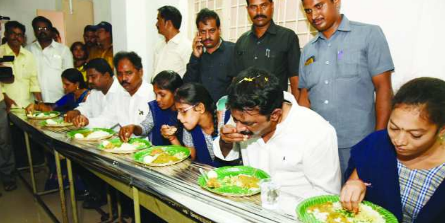
మధ్యాహ్న భోజన పథకాన్ని ప్రారంభించిన అనంతరం విద్యార్థులతో కలిసి సహచర్య భోజనం చేస్తున్న విద్యాశాఖామాత్యులు గంటా శ్రీనివాసరావు, ఎమ్మెల్యే వాసుపల్లి గణేష్ కుమార్

విశాఖపట్నం: ప్రభుత్వ పాఠశాలల్లో విద్యార్థుల ట్రాఫిక్ సంఖ్య తగ్గించేందుకు, వారిలో పోషకాహార లోపం లేకుండా చూసేందుకు, ఫలితాలు మెరుగుపరచడానికి అమలు చేస్తున్న ఈ పథకం వల్ల అన్ని ప్రభుత్వ స్కూళ్లలో మంచి ఫలితాలు వస్తున్నాయన్నారు. దీనిని త్వరలో అన్ని ప్రభుత్వ, ప్రైవేటు కళాశాలల్లో ఉన్న ఇంటర్మీడియట్ విద్యార్థులకూ దీనిని అమలు చేయనున్నట్లు రాష్ట్ర తరువాయి 2లో..