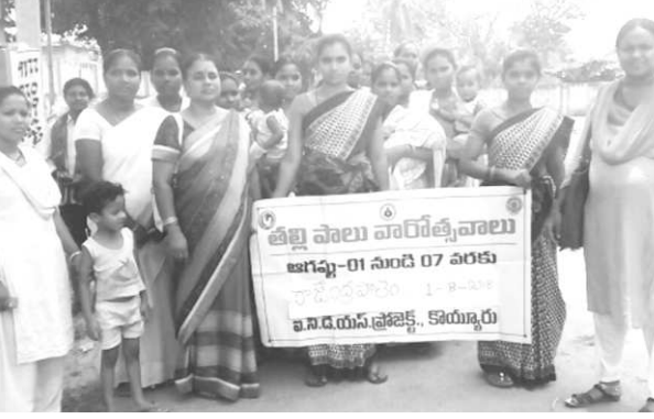
అవగాహన ర్యాలీ నిర్వహిస్తున్న దుశ్యం