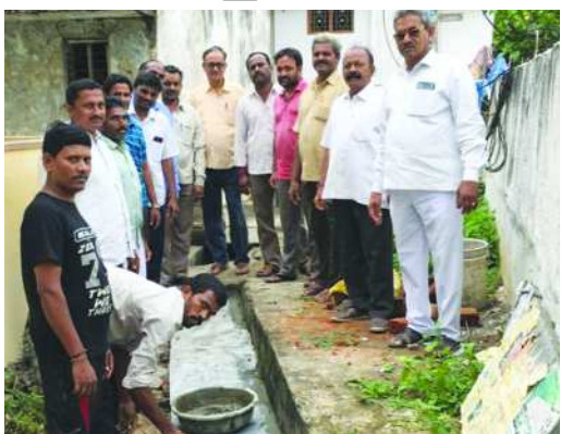
స్టం డించి నీ క్రి క ల్లి మా గ చ నే ణ నమతి