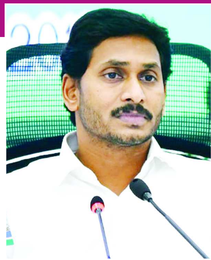
అమరావతి : ఉద్ధానం సమస్యపై ఆంధ్రప్రదేశ్ ప్రభుత్వం కీలక నిర్ణయం తీసుకుంది. కిచ్చీ బాధితుల కోసం శ్రీకాకుళం జిల్లా పలాసలో 200 పడకల

సంపుటి : 42 సందిక్ : 309 పేజీలు : 8 వెల : 1 రూపాయి