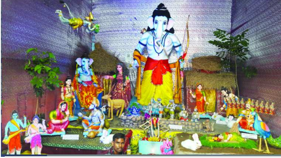
చోడవరం రామ్మోహనరావుపేటలో రామాయణ ఇతిహాసంతో ఏర్పాటు చేసిన వినాయక మండపం