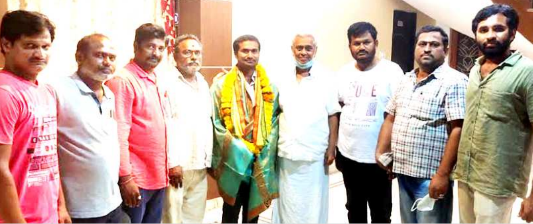
పరవాడ మండలం తెలుగుదేశం పార్టీ నూతన అధ్యక్షులు వియ్యపు చిన్న గౌరవంగా మాస్టర్ని కలవడం జరిగింది. మండల అధ్యక్షులు చిన్న ని సత్కరించి మండలం లో తెలుగుదేశం పార్టీ బలోపేతానికి కృషి చేయాలని పైలా సన్మానిస్తూ, మాస్టర్ ఆహ్వానించారు. తెలుగుదేశం పార్టీ నాయకులు అభినందించారు.