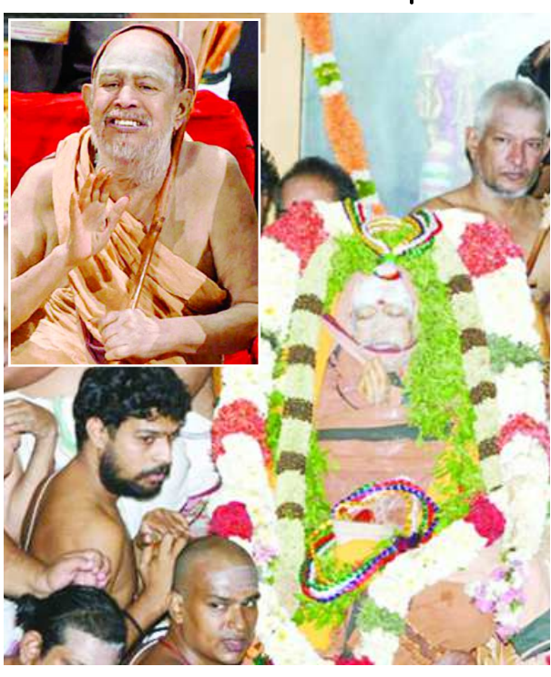
అభినవ శంకరులుగా ప్రసిద్ధిగాంచిన జయేంద్ర సరస్వతి 1935, జూలై 18న తమిళనాడులోని మన్నార్గుడి సమీపంలోని ఇరులసిక్కి గ్రామంలో జన్మించారు. ఆసలు పేరు తరువాయి 2లో

కాంచీపురం: కంచి కామకోటి పీఠాధిపతి జయేంద్ర సరస్వతి (82) శివైక్యం చెందారు. కొంతకాలంగా ఆయన శ్వాస సంబంధిత వ్యాధితో బాధ పడుతున్నారు. కంచి మఠంలోనే ఉన్న జయేంద్ర సరస్వతి వద్దకు తమిళనాడు గవర్నర్ భస్మరీలాల్ పురోహిత్ మంగళవారం వచ్చి ఆయన ఆశీర్వాదం తీసుకుని వెళ్లారు. ఆరోజు రాత్రి జయేంద్ర సరస్వతికి ఒక్కసారిగా శ్వాస సమస్యలు తలెత్తడంతో శిష్యులు కంచి మఠానికి చెందిన ఆస్పత్రికి తరలించారు. వైద్యులు ఆయనకు మెరుగైన చికిత్స అందించి సప్పటికీ ఫలితం లేకపోయింది. దీంతో బుధవారం ఉదయం 9 గంటల సమయంలో కంచిలోని శంకర మల్టీస్పెషాలిటీ ఆస్పత్రిలో ఆయన తుదిశ్వాస విడిచారు.