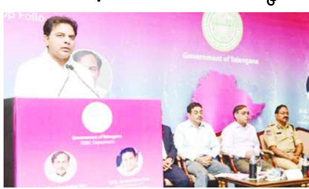
హైదరాబాద్: ఈ ఏడాది ఆఖరు నాటికి రాష్ట్రంలో కోటి ఇళ్లకు 15 ఎంబీఎస్ వేగంతో ఇంటర్నెట్ సదుపాయం కల్పిస్తామని తెలంగాణ ఐటీ శాఖ మంత్రి కేటీఆర్ వెల్లడించారు.

బీయాప్ ఫోలియో యాప్ అవిష్కరించిన మంత్రి కేటీఆర్ కొత్తపల్లెటూరు తొక్కలను సాంకేతిక పరిజ్ఞానం సామాన్యుడికి ఉపయోగపడితేనే దానికి విలువ ఉంటుందని, సమాచార శుభ్రం నుంచి సమాచార విప్లవం దాకా ఎన్నో మార్పులొచ్చాయని ఆయన తెలిపారు. రాష్ట్ర ఎలక్షన్లో సేవల విభాగం అధ్యక్షులతో అభివృద్ధి చేసిన టీయాప్ ఫోలియో యాప్ను ఐటీసీ కాకతీయ హాటల్లో ఆయన బుధవారం అవిష్కరించారు. ఈ సందర్భంగా కేటీఆర్ మాట్లాడుతూ.. రాష్ట్ర ప్రభుత్వానికి చెందిన వివిధ విభాగాల మొబైల్ యాప్లను ఐటీసీ వేదికగా అభివృద్ధి చేసింది. తరువాయి 2లో