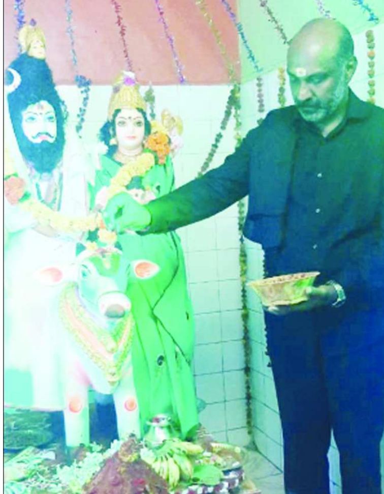
గాజువాక, దయాల్ నగర్ గౌరవరమేళ్ళుల ఉత్సవాల్లో పాల్గొన్న ఎమ్మెల్యే గణబాబు

పైవేటు విద్యా సంస్థలపై నియంత్రణ పైవేటు విద్యా సంస్థల్లో నిబంధనల అమలు, నాణ్యతా ప్రమాణాల స్థితిగతులను ఎప్పటికప్పుడు పరిశీలించాలని సీఎం ఆదేశించారు. పైవేటు విద్యాసంస్థలు ఇబ్బడిముబ్బడిగా ఫీజులు వసూలు చేస్తున్నాయని.. వీటిని నియంత్రించాలన్నారు. నియోజకవర్గాన్ని ఒక యూనిట్గా తీసుకుని