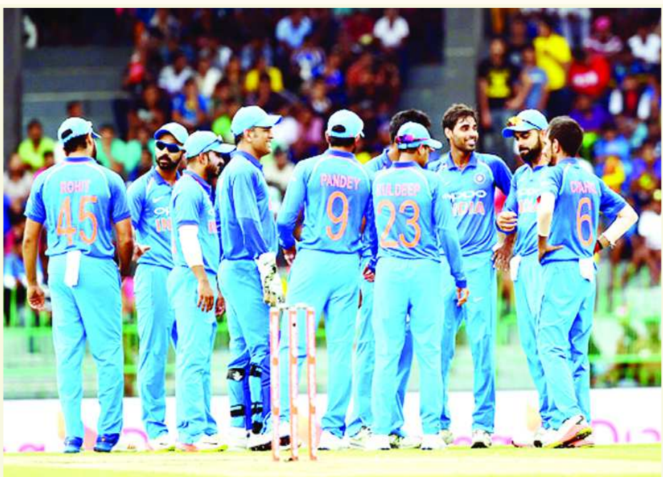
హైదరాబాద్: క్రికెట్ అభిమానులకు ఇక పండగ! రానున్న కాలంలో కోహ్లాసేన మరిన్ని టీ20 మ్యాచ్లు ఆడనుంది. క్రికెట్ ప్రేమికులను పరుగుల వరదలో తడిపేయనుంది. ప్రస్తుత

• కొత్త ఎఫ్టీపీలో మూడు రెట్లు ఎక్కువ మ్యాచ్లు • 54 టీ20లు ..