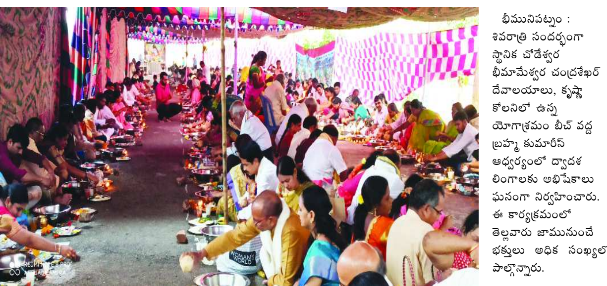
భీమిలిపట్నం : శివరాత్రి సందర్భంగా స్థానిక చౌడేశ్వర భీమేశ్వర చంద్రశేఖర్ దేవాలయాలు, కృష్ణా కోటలో ఉన్న యోగాశ్రమం టీవీ వద్ద బ్రహ్మ కుమారీస్ ఆధ్వర్యంలో ద్వారక లింగాలకు అభిషేకాలు పునంగా నిర్వహించారు. ఈ కార్యక్రమంలో తెల్లవారు జామునుంచే భక్తులు అధిక సంఖ్యలో పాల్గొన్నారు.