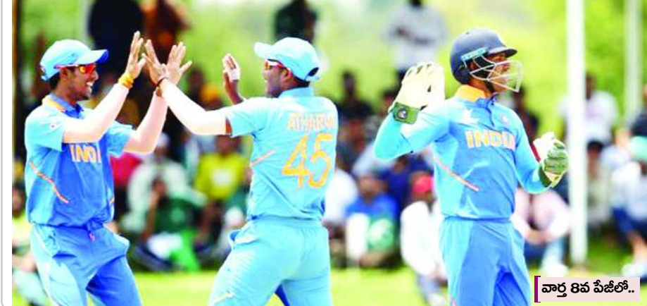
వార్త 8వ పేజీలో..