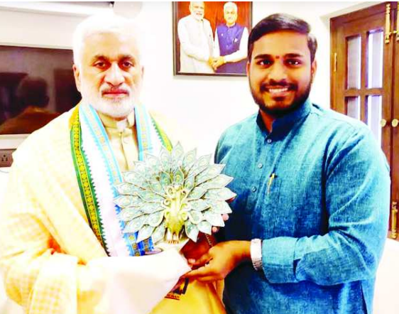
న్యూఢిల్లీ : రాజ్యసభ సభ్యులు, ఆంధ్రప్రదేశ్ రాష్ట్ర ప్రభుత్వ డిప్యూటీ ప్రెసిడెంట్ విజయసాయి రెడ్డి ని ఢిల్లీలోని ఆయన నివాసంలో వైయస్సార్