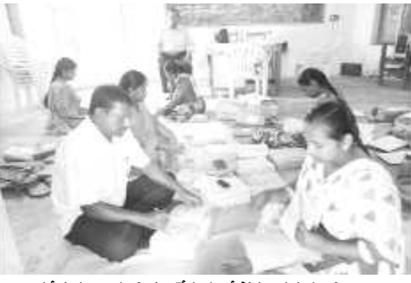
పరీక్ష పత్రాలను సిద్ధం చేస్తున్న రీసౌరు పర్సన్లు, సిబ్బంది

చోడవరం : ప్రభుత్వ పాఠశాలల్లో ఈ నెల 22 నుండి జరుగబోవు సమ్మెటీవ్ -1 పరీక్షలకు ప్రశ్నపత్రాలను, మెటీరియల్ను సిద్ధం చేస్తున్నట్లు మండల విద్యాశాఖాధికారి జి.జె.సుందర్ సింగ్ సోమవారం విడుదల చేసిన ఓ ప్రకటనలో తెలియజేశారు.