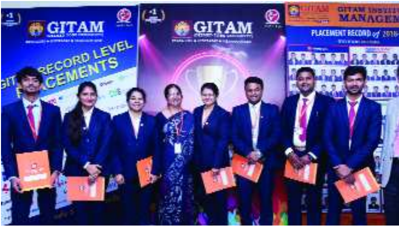
55 సంస్థలు ఉన్నాయి. ప్రాంగణ నియామకాలలో అత్యధిక వేతనం రూ.9 లక్షల రూపాయల నుంచి అభినందించారు.

సాగర్ నగర్: గీతం డీవ్స్ విశ్వవిద్యాలయం ఇనిస్టిట్యూట్ ఆఫ్ మేనేజ్మెంట్ ద్వారా ఎంబిఎ కోర్సులు అభ్యసించిన 150 మందికి ప్రాంగణ నియామకాలలో ఉద్యోగాలు సాధించారు. ప్రాంగణ నియామకాలు నిర్వహించిన సంస్థలలో స్టేట్ బ్యాంక్ ఆఫ్ ఇండియా కార్డ్స్, ఎస్ బిఐ లైఫ్, ఐసిఐసిఐ బ్యాంక్, బంధన బ్యాంక్ వంటి ప్రసిద్ధ సంస్థలతో పాటు ఇన్ వెస్కో, అమెజాన్, ఐటిసి, నెస్లే, వాల్ మార్ట్, హబ్ లెన్స్, క్రాఫ్టర్ గ్రీన్స్, ఫ్లిఫ్ కార్డ్, టివిఎస్ మోటార్స్, ముత్తూర్ పై నాస్ వంటి