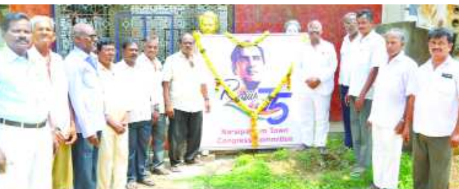
రాజీవ్ గాంధీ చిత్రపటానికి నివాళు అర్పిస్తున్న దృశ్యం