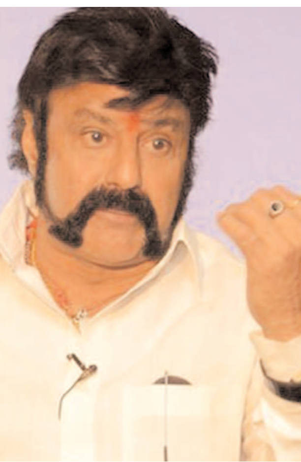
పాటలు విని నవ్వుతుంటాడు.

రోజుల్లోనే సినిమాలు చేసేవారు. రాత్రింబవళ్లు కష్టపడేవారు. ఇప్పుడు తక్కువ రోజులంటే భయపడిపోతున్నారు. సిని పరిశ్రమపై ఎంతో మంది ఆధారపడివున్నారు. చాలా మందికి సిని రంగం ఉపాధికల్పిస్తున్నది. వేగంగా సినిమాలు చేస్తే మరింత మందికి జీవనోపాధి కల్పిస్తున్నట్లువుతుందనిపించింది. ప్రతి సినిమాను తొందరగా చేయాలని నిర్ణయించుకున్నాను. సుదీరే సిని ప్రయాణంలో జానపదం, చారిత్రకం, ఫాంటసీ ఇలా భిన్న నేపథ్యాలతో సినిమాలు చేశాను. మూసాధారణలో సినిమాలు చేయడం నాకు నచ్చదు. నా నేచర్ అది కాదు. ప్రతిసారి కొత్త కథలు, ఆర్టిస్టులతో పనిచేయాలనుకుంటాను. చేయగల సత్తా, క్రమశిక్షణ నాన్న నుంచి వచ్చాయి. అందుకే ప్రతి సినిమాను వేగంగా పూర్తిచేస్తాను.