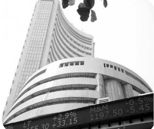
ముంబయి: దేశీయ సూచీలు గురువారం లాభాలతో ముగిశాయి. ఆగస్ట్ డెరివేటివ్స్ సెటిల్మెంట్ల నేపథ్యంలో ఆరంభ ట్రేడింగ్ లో సూచీలు కాస్త తడబడినా.. చివర్లో కొనుగోళ్ల జరగడంతో లాభాలను సాధించాయి. సెన్సెక్స్

80 పాయింట్లు లాభపడగా.. నిస్సీ మళ్ళీ 9,900 మార్కును దాటింది. అంతర్జాతీయ మార్కెట్ల సానుకూలతతో క్రితం సెషన్లో బలంగా పుంజుకున్న సెన్సెక్స్.. గురువారం వాటి ట్రేడింగ్ ఆరంభంలో 43 పాయింట్లు కోల్పోయి 31,603 వద్ద బలహీనంగా ప్రారంభమైంది. ఆగస్టు డెరివేటివ్స్ ముగింపు నేపథ్యంలో మదువర్ష లాభాల స్వీకరణకు మొగ్గుచూపడంతో సూచీ ఒత్తిడికి గురైంది. అయితే మధ్యాహ్నానికి కొనుగోళ్ల పెరగడంతో కొలుకున్న సూచీ.. చివరకు 84 పాయింట్లు లాభపడి 31,730 వద్ద ముగిసింది. అటు నిస్సీ కూడా 33 పాయింట్లు లాభంతో 9,918 వద్ద స్థిరపడింది. డాలర్ లో రూపాయి మారకం ఎలవ రూ. 63.91గా కొనసాగుతోంది. ఎన్ఎస్ఐసీలో విప్లవ, మారుతి సుజుకీ, టాటాపవర్, రిలయన్స్, బజాజ్ ఆటో పేర్లు లాభపడగా.. బాప్ లిమిటెడ్, భారత్ ఇన్ఫ్రాటెల్, కోల్ ఇండియా, ఇస్కోనిస్, అరబింద్ ఫార్మా పేర్లు నష్టపోయాయి.