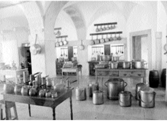
బాయిలర్లు వాడే వాళ్ళు. ఇందులో వేడి చేసిన నీరు వాడడం వల్ల చర్మ సంబంధిత రోగాలు కూడా తగ్గేవని రుజువు చెయ్యబడ్డాయి.

ఈ రోజుల్లో కూడా పూజాది కార్యక్రమాలకి వెండి, బంగారు పాత్రలు ఉపయోగించే వారు లేకపోలేదు. అయితే ఒకప్పుటికంటే ఇప్పుడు అలాంటివారి సంఖ్య తగ్గిందనే చెప్పాలి. ఇక మధ్యతరగతి వారు కూడా ఇత్రడి - రాగి పాత్రలను వాడటం చాలావరకు తగ్గించారు. ఈ నేపథ్యంలో ఇప్పుడు ఎవరి ఇంట్లో చూసినా స్టీలు పాత్రలే దర్శనమిస్తున్నాయి. పూజకి ఉపయోగించే అన్ని రకాల పాత్రలు నేడు స్టీలులోనే కనిపిస్తున్నాయి. నగిడి కారణంగా స్టీలు ... ఇనుము అనే భావన కలగనియదు. ఈ కారణంగానే దీని వాడకం అంతకంతకూ పెరుగుతూపోతోంది.అయితే ఇటు ఆరోగ్యపరంగాను ... అటు ఆధ్యాత్మిక పరంగాను స్టీలు పాత్రలను వాడకూడదని శాస్త్రం చెబుతోంది.