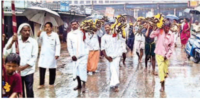
త్వరలోనే భక్త ముహూర్తాన్ని నిర్వహిస్తారు. దీంతో పర్యాటక ఏర్పాట్లు పూర్తయ్యాయి.

ఇప్పటికే బాళి, అక్కి, ముహూర్తాల్ని నిర్వహించారు. త్వరలోనే భక్త ముహూర్తాన్ని నిర్వహిస్తారు. దీంతో పర్యాటక ఏర్పాట్లు పూర్తయ్యాయి.