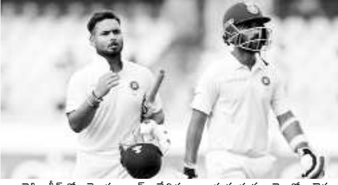
వెస్టిండీస్ తో హైదరాబాద్ వేదికగా జరుగుతున్న రెండో టెస్టు మ్యాచ్ లో భారత్ జేరు కొనసాగిస్తోంది. ఆటలో రెండో రోజైన శనివారం తొలి సెషన్ లోనే వెస్టిండీస్ జట్టుని 311 పరుగులకి ఆటోట్ చేసిన టిమోండియా.. ఈరోజు ఆట ముగిసే సమయానికి తొలి ఇన్నింగ్స్ లో 308/4తో మెరుగైన స్థితిలో నిలిచింది. క్రీజాలో రిషభ్ పంత్ (85 బ్యాటింగ్: 120 బంతుల్లో 10x4, 2x6), అజింక్య రహనే (75 బ్యాటింగ్:

174 బంతుల్లో 6x4) ఉండగా.. భారత్ ఇంకా 3 పరుగులు తొలి ఇన్నింగ్స్ లో వెనకబడి ఉంది. ఓపెనర్ కేవల రాహుల్ (4), చతేశ్వర్ పుజారా (10) ఫయిల్లైనా యువ ఓపెనర్ పుష్పీ షా (70: 53 బంతుల్లో 11x4, 1x6) అర్ధశతకంతో మెరిశాడు. అరంగేట్రం టెస్టులోనే శతకం బాది సూపర్ ఫామ్ లో ఉన్న పుష్పీ షా ఎడాపెడా బౌండరీలు బాదేశాడు. ఈ క్రమంలోనే అర్ధశతకాన్ని పూర్తి చేసుకున్న ఈ 18 ఏళ్ల క్రెకెటర్.. జట్టు స్కోరు 98 వద్ద బెటయ్యాడు. అనంతరం వచ్చిన కెప్టెన్ విరాట్ కోహ్లా (45: 78 బంతుల్లో 5x4) అర్ధశతకానికి చేరువలో వికెట్ చేశారుకున్నా.. అజింక్య రహనేతో కలిసి నాలుగో వికెట్ కి 60 పరుగుల కీలక భాగస్వామ్యంతో జట్టుని మెరుగైన స్కోరు దిశగా నడిపించాడు. శనివారం ఓవర్ నైట్ స్కోరు 295/7తో తొలి ఇన్నింగ్స్ ని కొనసాగించిన వెస్టిండీస్ జట్టులో రోస్టర్ చేజ్ (106: 189 బంతుల్లో 8x4, 1x6) ఆరంభంలోనే శతకాన్ని నమోదు చేశాడు. అయితే.. ఆ తర్వాత కొద్దిసేపటికే ఉమేశ్ యాదవ్ (6/88) బంతితో చెలరేగి బిషు (2), రోస్టర్ చేజ్, గాబ్రిల్ (0) పెవిలియన్ బాట పట్టించడంతో.. తొలి సెషన్ లోనే వెస్టిండీస్ మొదటి ఇన్నింగ్స్ ముగిసింది. నిన్న కుల్చీవ్ యాదవ్ 3, అశ్విన్ ఒక వికెట్ తీసిన విషయం తెలిసిందే.