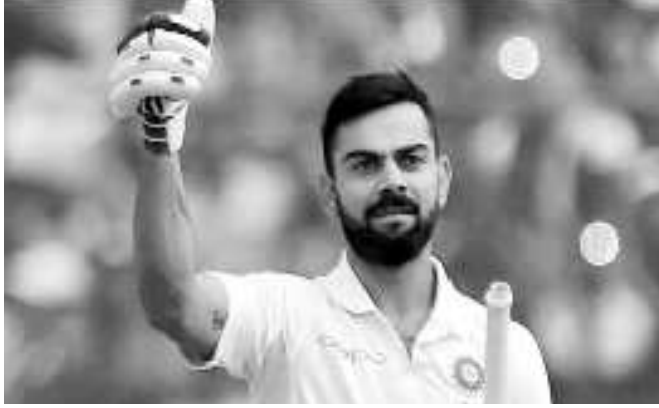
ఇప్పటివరకు ఈ రికార్డు డాన్ బ్రాడ్ మన్ మీద ఉంది. ఇతడు 68 ఇన్నింగ్స్ లో 25 సెంచరీలు చేశాడు.

హైదరాబాద్: టిమోండియా సారథి విరాట్ కోహ్లా సరికొత్త రికార్డు నెలకొల్పాడు. అత్యధిక పరుగులు సాధించిన ఆసియన్ కెప్టెన్ గా చరిత్ర సృష్టించాడు. పాకిస్తాన్ మాజీ కెప్టెన్ మిస్సా- ఉల్-హక్ పేరిట ఉన్న రికార్డును కోహ్లా అధిగమించాడు. హైదరాబాద్ లోని ఉప్పల్ స్టేడియం వేదికగా జరుగుతున్న రెండో టెస్టు తొలి ఇన్నింగ్స్ లో భాగంగా కోహ్లా 45 పరుగులు చేసి ఈ రికార్డును నెలకొల్పాడు. మిస్సా 56 మ్యాచుల్లో 51.39 పరుగుల సగటుతో 4,214 పరుగులు చేశాడు. ఇందులో మొత్తంగా మిస్సా 8 సెంచరీలు చేశాడు. అయితే కోహ్లా ఈ రికార్డును 42 మ్యాచుల్లోనే సాధించగలిగాడు. 42 మ్యాచుల్లో కోహ్లా 65.12 సగటుతో 4,233 పరుగులు చేసి పాకిస్తాన్ క్రెకెటర్ రికార్డును బద్దలు కొట్టాడు. దీంతో అత్యధిక పరుగులు చేసిన ఆసియన్ కెప్టెన్ గా నిలిచాడు. దీంతోపాటు కోహ్లా మరో రికార్డును చేరువలో ఉన్నాడు. ఇప్పటి వరకు తన టెస్టు కెరీర్ లో 24 సెంచరీలు చేసిన కోహ్లా మరో శతకం పూర్తి చేస్తే.. వేగంగా 25 సెంచరీలు పూర్తి చేసుకున్న రెండో బ్యాట్స్ మెన్ గా నిలుస్తాడు.