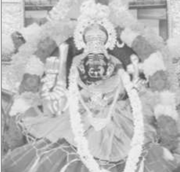
జగన్మోహన్ రెడ్డి, అక్కయ్యపాలెంలో గల శ్రీకామేశ్వర అమ్మవారి ఆలయంలో శ్రీ లలితా త్రిపురసుందరి దేవి ఆలంకరణతో భక్తులకు దర్శనమిచ్చారు.

కోర్టులకుటట్టా తిప్పుతున్నారన్నారు. కెసిఆర్ అధికారంలోకి వచ్చిన వెంటనే వారి కుటుంబంలోనున్న కేసులను ఎత్తివేసి కుటుంబ పాలన సాగిస్తున్నారని ఆరోపించారు. లోపాయికారీగా బెజిపీతో ఒప్పందం కుదుర్చుకొని ముందున్న ఎన్నికలకు వెళ్ళడాన్ని ప్రజలు తీవ్రంగా వ్యతిరేకిస్తున్నారన్నారు. తెలంగాణ ఇచ్చిన కాంగ్రెస్ పార్టీకి ప్రజలు పట్టం కట్టేందుకు సిద్ధంగా ఉన్నారని మహాకుటుంబంలోని అన్ని పార్టీలు కలుపుకుని అన్ని సీట్లను కైవసం చేసుకుంటామన్నారు. గద్దరాలాటి విప్లవనాయకుడు కాంగ్రెస్ పార్టీతో జతకలసి వెళ్ళడం శుభవరణమే అన్నారు.