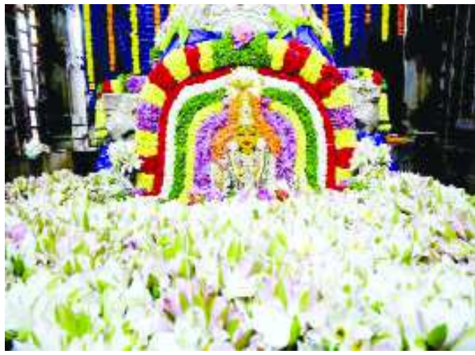
వనటాన: శరన్నవరాత్రులలో భాగంగా స్థానిక భక్తులను ఎంతగానో ఆలంబించింది.