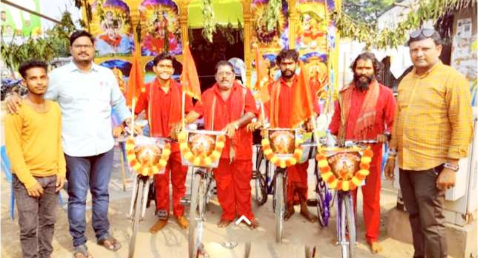
భీమునిపట్నం: జగన్మాత ఇంద్రకీలాద్రిపై వెలిసిన తల్లిదేవి నవరాత్రులు సందర్భంగా మాల ధరించి, విజయవాడ కనక