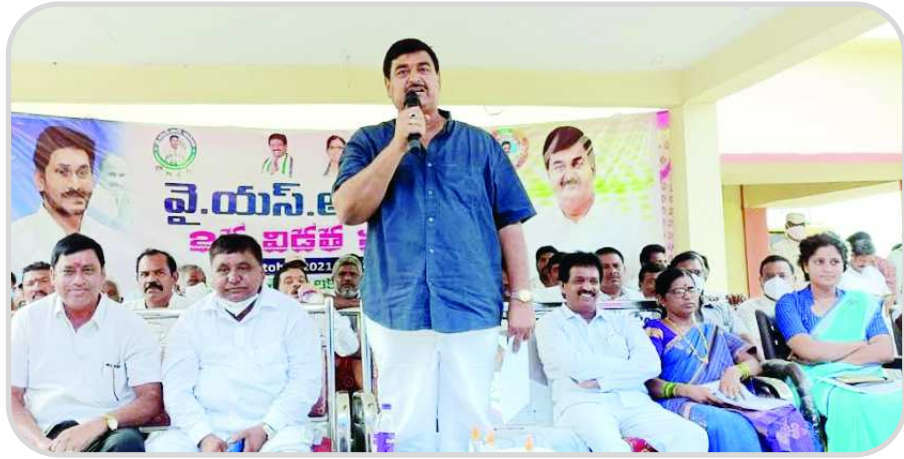
శ్రీకాకుళం : ఆసరా సహాయం కుటుంబాల ఆర్థిక బలోపేతానికి వినియోగించాలని డిప్యూటీ సీఎం ధర్మాన కృష్ణదాస్ కోరారు. నరసన్నపేట నియోజకవర్గం నరసన్నపేట మండలం ఉద్ధాం గ్రామ పంచాయతీ ఉన్నత పాఠశాల

ఆసరాలో సోమ వారం జరిగిన వైయస్సార్ ఆసరా రెండో విడత నిధులు విడుదల సంబంధాలకు ముఖ్య అతిథిగా డిప్యూటీ సీఎం ధర్మాన కృష్ణదాస్ హాజరయ్యారు. డిప్యూటీ సీఎం మాట్లాడుతూ వై.ఎస్.ఆర్. ఆశీస్సులు, ఆ దేవుని చల్లని దీవెనలతో దేశంలో అత్యుత్తమ సీఎంలలో జగన్ మూడవ స్థానంలో ఉన్నారన్నారు. రాజకీయాలు అంటే గొప్ప పాలన, పౌరదర్శకత అనుకునేలా తీర్చిదిద్దారని ఆయన చెప్పారు. పేద పిల్లలు ఇంగ్లీష్ మీడియంలో గొప్ప చదువులు చదువుకావాలని ముఖ్య మంత్రి ఇంగ్లీష్ మీడియం ను ప్రవేశ పెట్టారని తెలిపారు. పేదల ఇళ్ళు కోసమని ప్రతిష్టాత్మకంగా తీసుకొని పాతిక వేల కోట్ల రూపాయలతో భూసేకరణ చేసి లక్షలాది కుటుంబాల కళ్ళలో ఆనందాన్ని నింపామని చెప్పారు. వైయస్సార్ ఆసరా నిధులను కుటుంబాల ప్రగతి కోసం, ఆర్థిక అభివృద్ధి కోసం సక్రమంగా వినియోగించుకావాలని ఆయన కోరారు. పలు ప్రైవేటు భాగస్వాములతో ప్రభుత్వం ఒప్పందం చేసుకుందని, వాటిలో దేని ద్వారా ప్రయోజనం కలుగుతుందో వాటిని ఎన్నుకొని ఆర్థికంగా బలోపేతం కావాలని సూచించారు. అందరూ రెండు డోసుల వ్యాక్సిన్షన్ పూర్తి చేసుకుని కరోనా మహమ్మారిని రాష్ట్రం నుంచి తరిమి కొట్టాలని విలుపు నిచ్చారు.