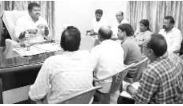
భీమనిపట్నం : పర్యాటక శాఖ మంత్రి మరియు భీమిలి శాసనసభ్యులు ముత్తంశెట్టి శ్రీనివాసరావు (అవంతి) భీమిలి క్యాంపు కార్యాలయంలో మూడు మండలాల మరియు జి.వి. ఎం.సి అధికారులచే రివ్యూ మీటింగ్ జరిగింది. ఈ మీటింగులో

యానాం : ఇటీవల నూతన మంత్రులుగా ప్రమాణ స్వీకారం చేసిన కేంద్ర మంత్రులను మర్యాదపూర్వకంగా పుదుచ్చేరి ఆరోగ్యశాల మంత్రి మల్లాడి కృష్ణారావు కలిసి దుశ్యాయివాలతో సత్కరించారు పుదుచ్చేరి వ్యాప్తంగా ఉన్నటువంటి పలు సమస్యల పరిష్కారానికి సంబంధించి సంబంధిత కేంద్ర మంత్రులను కలిసి పుదుచ్చేరి అభివృద్ధి, సంక్షేమానికి, ఉపాధికి, సహాయ సహకారాలు అందించాలని కోరారు పుదుచ్చేరి ఉండటంవల్ల కేంద్రం అందించే సహాయ సహకారాలతో మాత్రమే పుదుచ్చేరి అభివృద్ధి జరుగుతుందని దీనికి తప్పనిసరిగా సహకరించాలని అని కోరారు ప్రధానంగా హెల్త్, ఇరిగేషన్ తదితర శాఖల మంత్రులు కలిశానన్నారు.