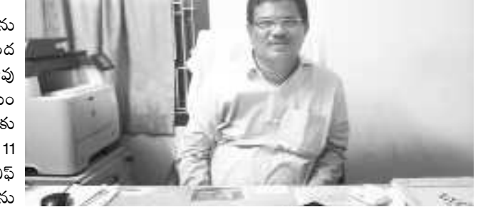
అత్యవసర, తలుపు పైకే సర్వీసు పరికరాల, ప్రాథమిక చికిత్స, రహదారి మ్యాప్, డ్రైవర్ హెల్త్ కార్డు మరియు డ్రైవర్ పూర్తి వివరాలు విధిగా వుండాలని తెలిపారు. ప్రతి బస్సులు బస్సులో వేగం వివరాలు పనిచేయాలని, లేని ఎడల ఆ వాహనములను కార్యాలయము నందు సీజ్ చేయబడునని పెద్దాపురం మోటార్ వెహికల్ ఇన్ స్పెక్టర్ పద్మాకర్ తెలిపారు.

ఎంపిపి పద్మాకర్ : పెద్దాపురం : పాఠశాలలు మరియు కాలేజీలకు విద్యార్థులను తీసుకుని వెళ్ళే బస్సులు బస్సులకు విధిగా ఫిట్ నెస్ సర్టిఫికేట్ పొంద వలెనని పెద్దాపురం మోటార్ వెహికల్ ఇన్ స్పెక్టర్ పద్మాకర్ రావు తెలిపారు. బుధవారం విలేకర్లతో మాట్లాడుతూ తన కార్యాలయం పరిధిలో గల 5 మండలాల నుండి వచ్చిన 67 బస్సులు బస్సులకు బుధవారం ఫిట్ నెస్ సర్టిఫికేట్ ఇవ్వడం జరిగి నదని, దీనిలో 11 బస్సులకు ఫిట్ నెస్ లేని కారణంగా అనుమతి నిరాకరించి సి పిఎల్ ఆర్ ఫారాలు ఇవ్వడం జరిగినదని, వెంటనే వారి వాహనాలను రిపేరు చేసి తన కార్యాలయానికి తీసుకుని రావలసి నదని తెలియజేసినట్లు తెలిపారు. 5 మండలాల పరిధిలో మిగిలిన 24 బస్సులు బస్సులకు వెంటనే ఎఫ్ఐ సర్టిఫికేట్ పొందాలని, ఎఫ్ఐ సర్టిఫికేట్ లేకుండా వాహనాలలో స్కూల్ పిల్లలను తీసుకుని వెళ్ళిన ఎడల, ఆ వాహనంపై కఠిన చర్యలు తీసుకోబడునని తెలిపారు. ప్రతి బస్సులో