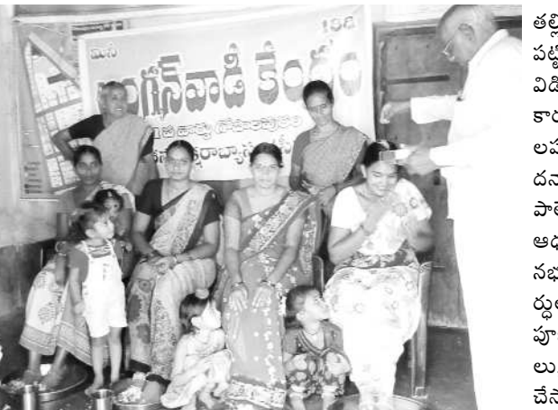
అమ్మకు వందనం కార్యక్రమం