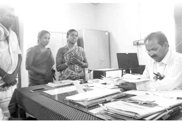
విజయనగరం లోని సమస్యల పరిష్కారం