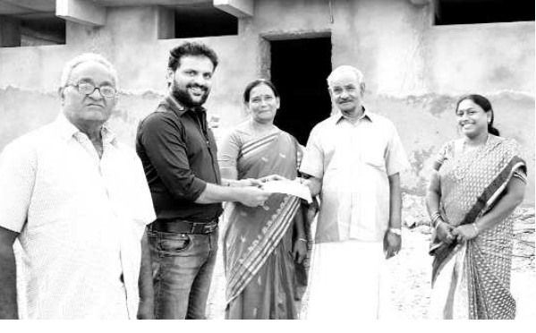
అయ్యతాపూరం: ధ్యానం చేయడం వలన మానసిక ప్రశాంతత చేకూరుతుందని బ్రాండ్లీస్ ఇండియా పార్ట్నర్ లన్నారు.