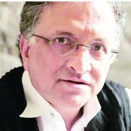
పోటీ ఇవ్వలేదు. కుంభే జట్టు విజయాల కోసం ఒంటరిగా పోరాడిన సందర్భాలు ఉన్నాయి. అతని కారణంగా భారత జట్టు మరపురాని విజయాలు

దిల్లీ: బీసీబి అధికారులు, సెలక్షర్లు, కోచింగ్ నిబ్బంది భారత క్రికెట్ జట్టు సారథి విరాట్ కోహ్లా ముందు మోకరిస్తున్నారని విమర్శించిన బోర్డు పాలకుల కమిటీ మాజీ సభ్యుడు రామచంద్ర గుహ తాజాగా కోహ్లా ఒత్తిడి మేరకే రవిశాస్త్రిని కోచ్ గా ఎంపిక చేశారని అన్నారు. తాజాగా ఓ వ్యాసంలో ఆయన బోర్డు అధికారులకు పలు ప్రశ్నలు సంధిస్తూ రవిశాస్త్రి ఎంపికను ఎండగట్టారు. భారత క్రికెట్ జట్టు విజయాల్లో కీలకపాత్ర లేని, కోచింగ్లో ఏమాత్రం అనుభవం లేని రవిశాస్త్రిని భారత జట్టు ప్రధాన కోచ్ గా ఎంపిక చేయడానికి ప్రధాన కారణం సారథి విరాట్ కోహ్లా. శాస్త్రిని కోచ్ గా తీసుకోవాలని కోహ్లా నుంచి బీసీబికి తీవ్ర ఒత్తిడి వచ్చింది. ఈ ఒత్తిడికి తలగ్గే రవిశాస్త్రిని ఎన్నుకున్నారు. మాజీ కోచ్ అనిల్ కుంభేకు శాస్త్రి ఏ విషయంలోనూ