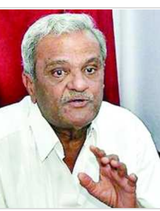
హైదరాబాద్: తెలుగు రాష్ట్రాల గవర్నర్ ఈఎన్ఎల్ నరసింహన్ ఆహ్వానాన్ని సీపీఐ జాతీయ నేత నారాయణ తిరస్కరించారు. జనవరి 26 గణతంత్ర దినోత్సవం సందర్భంగా నిర్వహించే ఎటోహాం కార్యక్రమానికి హాజరు కావాలని కోరుతూ ఆయన ఆహ్వానం పంపగా.. తాను హాజరు కాలేకపోతున్నానని నారాయణ స్పష్టంచేశారు. ఈ సందర్భంగా నారాయణ గవర్నర్ ను ఉద్దేశించి కీలక వ్యాఖ్యలు చేశారు. గవర్నర్ అంటే వ్యక్తిగతంగా తనకు గౌరవమేనన్నారు. కానీ ఆ హెరాడోల్ ఆయన చేస్తున్న వ్యాఖ్యలు, వ్యవహారస్తున్న తీరు మాత్రం అసంతోషాన్ని ఉన్నాయని నారాయణ అభిప్రాయపడ్డారు.