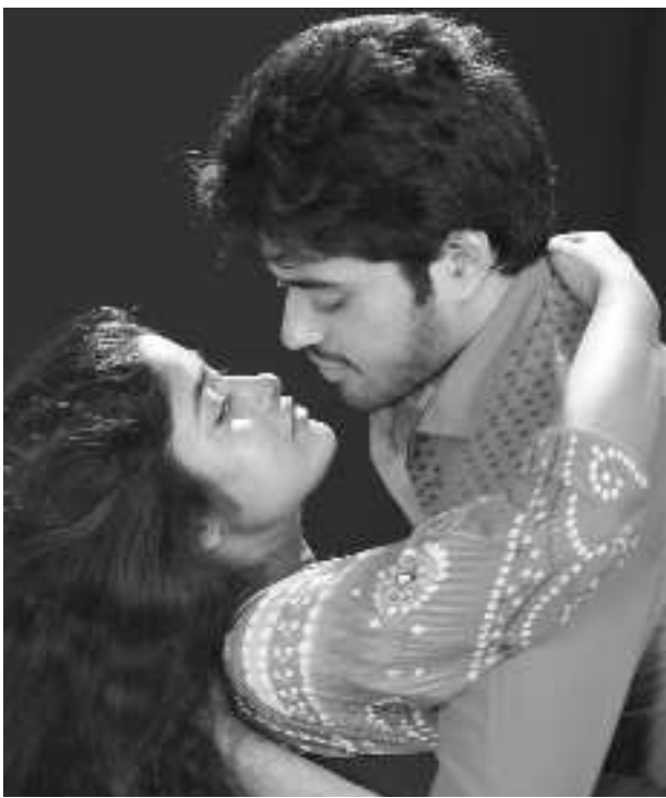
గల్ఫ్ ఓ లైబ్రరీగా నిలుస్తుంది!