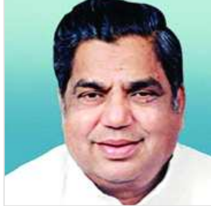
ముగ్గురు పిల్లలు ఉన్నారు. 2004 నుంచి 2006 వరకు ధరమ్ సింగ్ కర్ణాటక ముఖ్యమంత్రిగా బాధ్యతలు నిర్వహించారు.

బెంగళూరు: కర్ణాటక మాజీ ముఖ్యమంత్రి ఎన్.ధరమ్ సింగ్(80) కన్నుమూశారు. కొంతకాలంగా పూవారితిత్తుల్లో సమస్యతో బాధపడుతున్న ఆయన్ను బెంగళూరులోని ఎంఎస్ రామయ్య ఆసుపత్రిలో చేర్చారు. అక్కడ వికిత్త పొందుతూ.. గురువారం ఉదయం 11.54 గంటలకు గుండెపోటుతో తుదిశ్వాస విడిచారు. ధరమ్ సింగ్ కి భార్య,