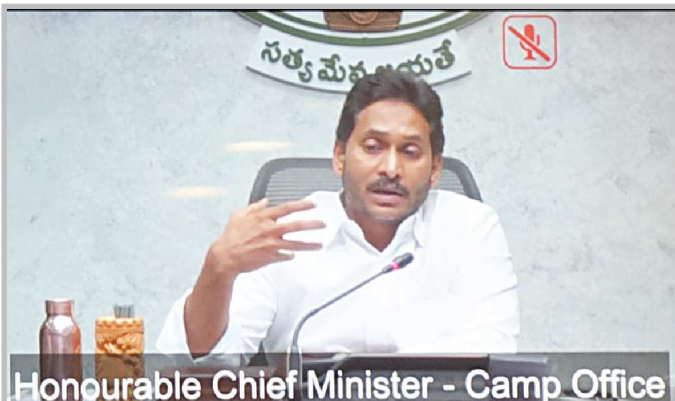
వై.ఎస్.జగన్ మోహన్ రెడ్డి అన్నారు. బుధవారం తాడేపల్లి క్యాంపు కార్యాలయం నుంచి అన్ని జిల్లాల కలెక్టర్లు, జాయింట్ కలెక్టర్లు, ఎస్పీలతో రాష్ట్ర ముఖ్యమంత్రి జగనన్నకు