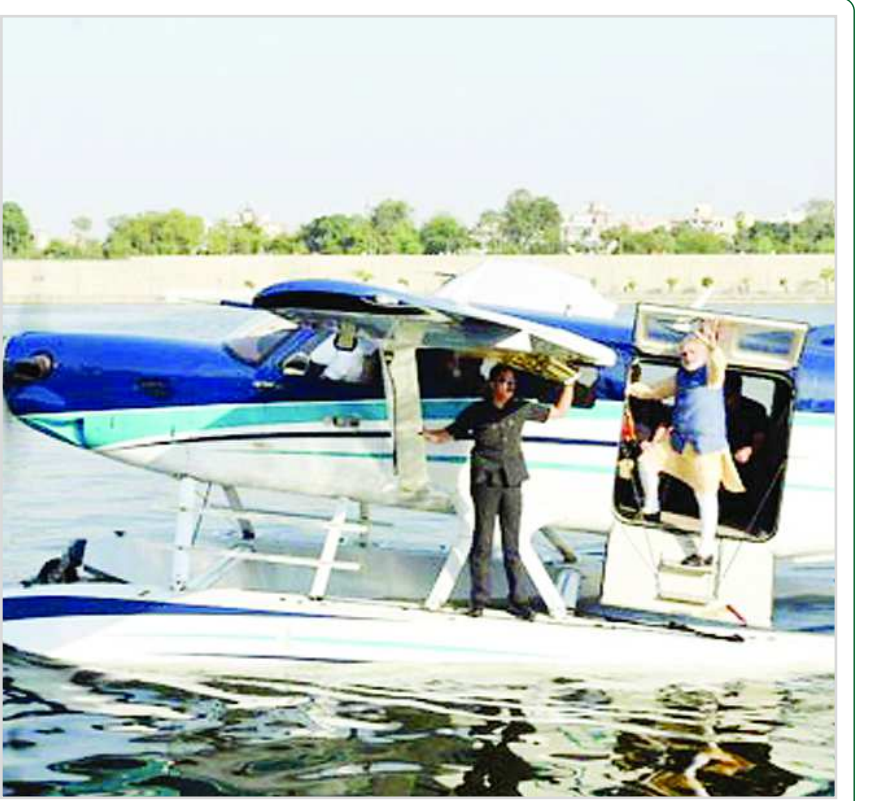
అభిమానులు భారీ సంఖ్యలో తరలివచ్చారు. మోదీ అక్కడికి చేరుకోగానే.. మోదీ.. మోదీ.. అంటూ బీజేపీ కార్యకర్తలు గినాదాలు చేశారు. విమానం ఎక్కే ముందు ప్రజలకు మోదీ అభివాదం చేశారు.

అహ్మదాబాద్ : ప్రధాని నరేంద్ర మోదీ తొలిసారిగా సముద్ర విమానంలో ప్రయాణించారు. గుజరాత్ రెండో విడత ఎన్నికల ప్రచారం ముగియనుంది. ఈ నేపథ్యంలో అహ్మదాబాద్లో రోడ్ షో నిర్వహించాలని బీజేపీ నిర్ణయించింది. అయితే శాంతిభద్రతల దృష్ట్యా మోదీ రోడ్ షోకు అహ్మదాబాద్ పోలిసులు అనుమతి ఇవ్వలేదు. దీంతో మోదీ సబరమతి నది నుంచి ధారోయ్ డ్యామ్ వరకు మోదీ సీట్లలో ప్రయాణించారు. అక్కడి నుంచి అంబాజీ డెంపుల్లో రోడ్డు మార్గాన చేరుకుని దేవున్ని దర్శించుకుంటారు. అనంతరం ఎన్నికల ప్రచారంలో మోదీ పాల్గొంటారు. మోదీ.. మోదీ.. అంటూ గినాదాలు ప్రధాని మోదీ సీట్ల ప్రయాణం నేపథ్యంలో సబరమతి నదీతీరం వద్దకు బీజేపీ కార్యకర్తలు, మోదీ