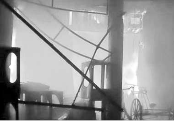
పెద్దవిత్తున మంటలు వెలరెగుతున్నాయి. పైరె సిబ్బంది అక్కడికి చేరుకుని మొత్తం 12 పైరె ఇంజన్లతో మంటలు అగ్నిమాపక ప్రయత్నిస్తున్నారు. కాగా ప్రమాదానికి గల కారణాలు, అగ్ని, ప్రాణనష్టం వివరాలు ఇంకా వెల్లడికాలేదు.

న్యూఢిల్లీ: డిల్లీలోని కమ్మా మార్కెట్లో అగ్ని ప్రమాదం దాటాక భారీ అగ్నిప్రమాదం చోటుచేసుకుంది. దాదాపు 100 పావులు మంటల్లో చిక్కకున్నాయి. దీనిపై సమాచారం అందుకున్న అగ్నిమాపక సిబ్బంది హుటాహుటిన కమ్మా మార్కెట్కు చేరుకుని పరిస్థితి అదుపులోకి తీసుకొచ్చారు. కాగా ఈ ప్రమాదంలో ఎవరికి గాయాలు కాలేదని అధికారులు వెల్లడించారు. డిల్లీలోని కమ్మా మార్కెట్లో అగ్ని ప్రమాదం చోటుచేసుకుంది. దాదాపు 100 పావులు మంటల్లో చిక్కకున్నాయి. దీనిపై సమాచారం అందుకున్న అగ్నిమాపక సిబ్బంది హుటాహుటిన కమ్మా మార్కెట్కు చేరుకుని పరిస్థితి అదుపులోకి తీసుకొచ్చారు. కాగా ఈ ప్రమాదంలో ఎవరికి గాయాలు కాలేదని అధికారులు వెల్లడించారు.