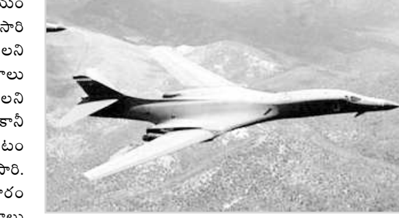
ఏదైనా ప్రత్యేక కార్యక్రమం కోసం చేయడం లేదని, అంతర్జాతీయంగా ప్రస్తుతం నెలకొన్న పరిస్థితుల నేపథ్యంలోనే ఈ చర్యలు తీసుకున్నామని అమెరికా వాయి సేన చీఫ్ ఆఫ్ స్టాఫ్ డేవిడ్ గోల్డ్ఫీన్ చెప్పారు. ఎటువంటి పరిస్థితులకైనా ఎదుర్కొనేందుకు తాము సిద్ధంగా ఉన్నామని తెలియజేయడానికి అమెరికా ఈ నిర్ణయం తీసుకుందని చెప్పారు.

వాషింగ్టన్ : అమెరికాకు కిమ్ జోన్ ఊన్ భయం పట్టుకుంది. ప్రచ్ఛన్న యుద్ధం ముగిసిన తర్వాత తిరిసారి వాయి సేనను నిరంతరం అప్రమత్తంగా ఉండాలని కోరింది. అణ్వాయుధాలు అమర్చిన యుద్ధ విమానాలు రోజులో 24 గంటలూ జాగ్రత్తగా వ్యవహరించాలని కోరింది. దీనికి సంబంధించిన ఆదేశాలు జారీ కాలేదు, కానీ బీ-52 యుద్ధ విమానాలు యుద్ధ సన్నద్ధంగా ఉండటం 1991లో ప్రచ్ఛన్న యుద్ధం ముగిసిన తర్వాత ఇదే తొలిసారి. డిఫెన్స్ వన్ వెల్లడించిన వివరాల ప్రకారం అణ్వాయుధాలతో కూడిన అమెరికా యుద్ధ విమానాలు అనుక్షణంగా సంసిద్ధంగా ఉంటాయి, ఆదేశాలు జారీ అయిన మరుక్షణం యుద్ధం చేయడానికి సిద్ధంగా ఉంటాయి. ఉత్తర కొరియా అణ్వాయుధాలతో దూకుతున్న ప్రదర్శించడం, కిమ్ జోన్ ఊన్ వైఖరిపై అమెరికా అధ్యక్షుడు డొనాల్డ్ ట్రంప్ పోరాట దృక్పథాన్ని చూపిస్తుండటం, రష్యా సాయుధ దళాల క్రియాశీలత వల్ల ఈ నిర్ణయం తీసుకున్నట్లు తెలిసింది. ఈ సన్నాహాలను