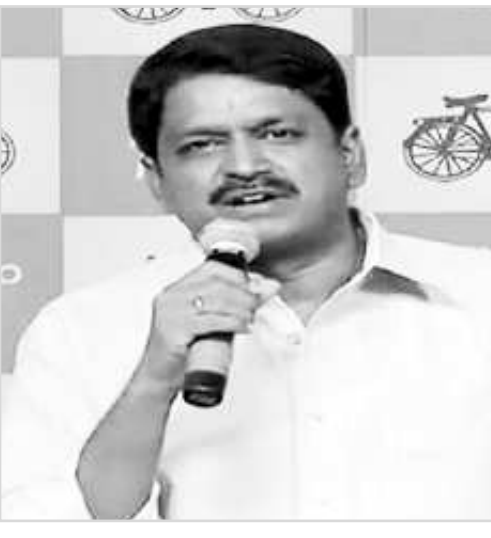
తెలిపారు. ఆయన చంద్రబాబును కలిశాక ఆ వివరాలపై స్పందిస్తానని అన్నారు. రేవంత్ కు వ్యక్తిగత

అమరావతి : తెలంగాణ తెదేపా కార్యనిర్వాహక అధ్యక్షుడు రేవంత్ రెడ్డి తనను ఉద్దేశించి చేసిన వ్యాఖ్యలు బాధించాయని ఆ పార్టీ ఎమ్మెల్యే, సీనియర్ నేత పయ్యావుల కేశవ్ అన్నారు. మీడియాతో పయ్యావుల కేశవ్ ఇష్టాగోష్టిగా మాట్లాడారు. రేవంత్ వ్యాఖ్యలపై స్పందించాడా? లేదా? అని సందర్భంలో పడ్డానని.. అయితే జనంలోకి తప్పుడు సందేశాలు వెళ్ళాయని మాట్లాడుతున్నారని పేర్కొన్నారు. చంద్రబాబును రేవంత్ రెడ్డి కలిశాక స్పందించాలని అనుకున్నాని చెప్పారు. వ్యక్తిగతంగానే స్పందిస్తున్నాని తెలిపారు.