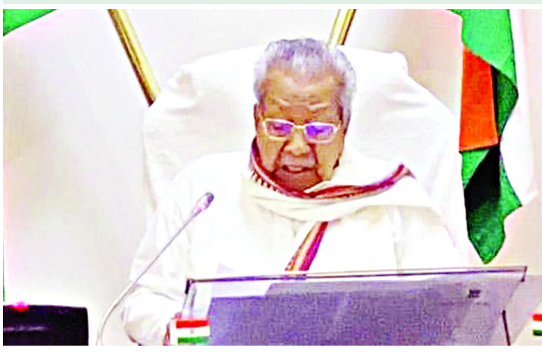
అమరావతి: రాష్ట్రంలో కోవిడ్-19 స్థితిగతులపై ఏపీ గవర్నర్ బిశ్వభూషన్ హరిచందన్ అధికారులతో సమీక్ష నిర్వహించారు. ఏపీ రాజభవన్ నుంచి ప్రభుత్వం ప్రధాన కార్యదర్శి సీలం సాహ్ని, ఆరోగ్య కుటుంబ సంక్షేమ ప్రత్యేక ప్రధాన కార్యదర్శి డా.వెంకటేశ్వర్లు ఇతర అధికారులతో మంగళవారం ఆయన వీడియో కాన్ఫరెన్స్

మొబైల్ టెస్టింగ్ వ్యాన్ల ద్వారా కరోనా పరీక్షలను ఎక్కువ సంఖ్యలో నిర్వహించడానికి ప్రభుత్వం చేస్తున్న కృషి అమోఘం రాష్ట్రంలో కోవిడ్-19 స్థితిగతులపై ఏపీ గవర్నర్ బిశ్వభూషన్ హరిచందన్ అధికారులతో సమీక్షా సమావేశం