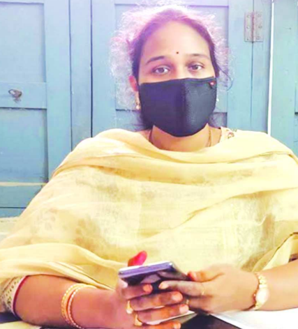
సర్పంచిత్వం : పరిశుభ్రత దిశగా పంచాయతీలు నడిపించాలని రాష్ట్ర ప్రభుత్వం ఆలోచన లో భాగంగా ఈ నెల 24 నుండి ఆగస్టు 15 వరకు పరిశుభ్రత

పక్షోత్సవాలు నిర్వహించతలపెట్టినది డివిజనల్ పంచాయతీ అధికారి ఆర్ శిరీష అని వెల్లడించారు. మంగళవారం ఆమె విలేజులలో మాట్లాడుతూ 24వ తేదీ ఉదయం 9 నుండి 12 గంటల వరకు , మధ్యాహ్నం 2 నుంచి 5 గంటల వరకు పైలెట్ ప్రాజెక్టు గ్రామాల్లో పరిశుభ్రత పక్షోత్సవాల కార్యక్రమాలపై సమావేశాలు నిర్వహిస్తారన్నారు. 25వ తేదీన యస్ హెచ్ జి ఇద్దరు సభ్యులు, ఇద్దరు త్రాగు నీటి నిర్వహణ కార్యకలాపాలు సభ్యులు, ఇద్దరు మురికి కాలువలో పూడిక తొలగించే సభ్యులు, ఇద్దరు ఎస్ డబ్ల్యూ పిసి సభ్యులు, ఇద్దరు ఆరోగ్యవరమైన కార్యకలాపాలు నిర్వహిస్తున్న వ్యక్తులతో కమిటీ ని ఏర్పాటు చేస్తారు . 27వ తేదీన గ్రామాల్లో అపరిశుభ్రంగా ఉన్న ప్రదేశాలు, దోమలు ఉత్పత్తి అయ్యే ప్రాంతాలు, గ్రామంలో నీరు నిల్వ ఉండే ప్రదేశాలు తదితర సమస్యలను గుర్తించేందుకు గ్రామ సచివాలయ సిబ్బంది, గ్రామ వాలంటీర్ తో కలిసి