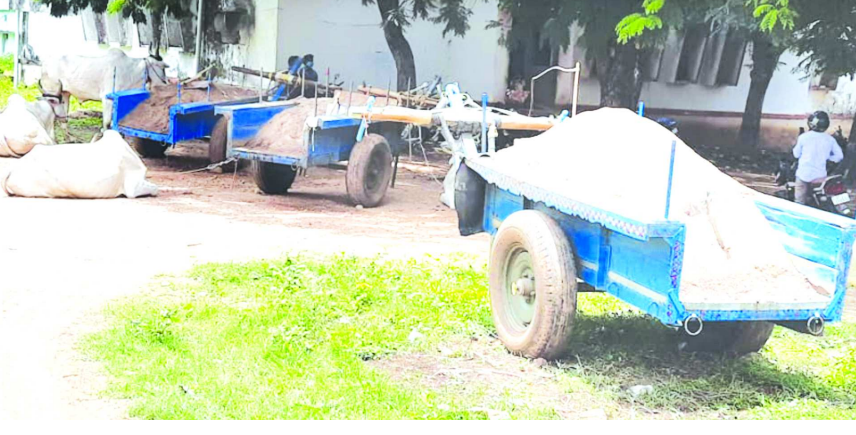
రాష్ట్ర ప్రభుత్వం ఇసుకను నాలుగు వాళ్ళతో తోలుకోవచ్చని ప్రభుత్వం చెప్పినప్పటికీ స్థానిక అధికారులు మాత్రం చాలా ఇబ్బందులకు గురి చేస్తున్నారని ఆవేదన చేస్తున్నారు. కనీసం పశువులకు గడ్డి

గొలుగొండ : గొలుగొండ మండలం చోడ్యం గ్రామం దగ్గర ఇసుకతో ఉన్న ఏడుదైరుబళ్ళను ఎడ్లలతో సహా ఎత్తేశానిని పట్టుకొని గొలుగొండ తహశీల్దార్ కార్యాలయంకు అప్పజెప్పారు. మంగళవారం ఉదయం పట్టుకున్న ఎడ్ల బండ్లను కనీసం మధ్యాహ్నం వరకు కూడా ఉన్నతాధికారులు స్పందించలేదని ఎడ్లబండి రైతులు ఆవేదన వ్యక్తం చేస్తున్నారు.