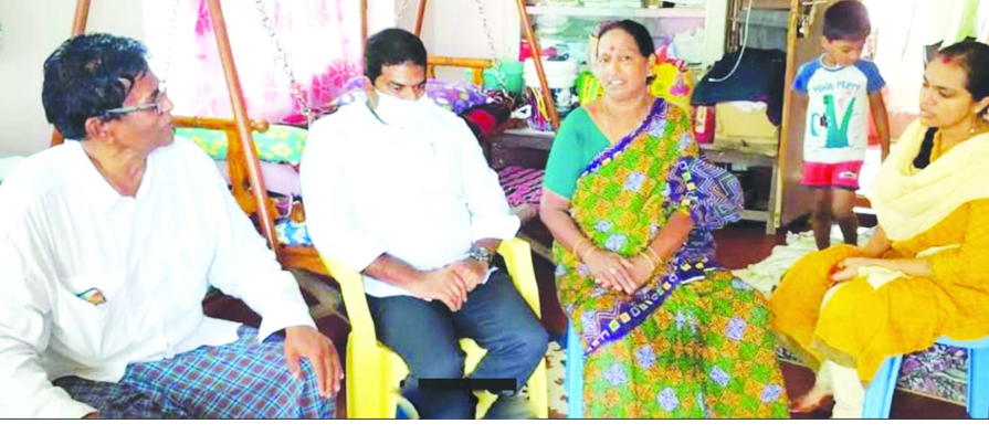
ఎటువంటి ముందస్తు నోటీసులు ఇవ్వకుండా ప్రత్తిపాడు సర్కిల్ పోలీసులు ఆదివారం అర్ధరాత్రి తలుపులు పగలగొట్టి ఇంటి లోనికి ప్రవేశించి అరెస్టు చేయడం తీవ్రంగా ఖండిస్తున్నామని, సుప్రీంకోర్టు ఆదేశాల ప్రకారం ముద్దాయిని అరెస్టు చేసే ముందు సి ఆర్ పి సి సెక్షన్ 41 ఏ ప్రకారం నోటీసు ఇవ్వాలి, కానీ పోలీసులే కోర్టు ఆదేశాలను తుంగలో తొక్కడం పట్ల వ్యతిరేక చర్యని, పోలీసులు