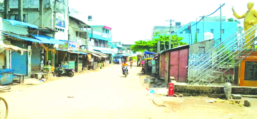
గంటల నుంచి మధ్యాహ్నం 1 గంట వరకు వ్యాపారాలు తీసుకోని అక్కడ నుంచి పూర్తిగా దుకాణాలు మూసివేస్తామని అధికారులకు తెలపడంతో వారు వ్యాపారులను అభినందించారు. ఈ విషయమై పోలీస్ వాచానంతో గ్రామంలో మైక్ ప్రచారం చేశారు. దీనికి గ్రామస్థులు సహకరించాలని పోలీసులు కోరారు.

దేవరాపల్లి : మండల కేంద్రంలో మరలా లాక్ డౌన్ ధాయలు కనిపించాయి. దేవరాపల్లిలో పాటు పలు గ్రామాల్లో కరోనా పాజిటివ్ కేసులు రోజు రోజుకీ పెరగడంతో మండల ప్రజలు భయభ్రాంతులకు గురవుతున్నారు. ఇప్పటికే మండలంలోని కాళీపురం, బి. కింతాడ, కొత్తపెంట, వేవలం గ్రామాల్లో కేసులు నమోదు కాగా బి.కింతాడలో ఇటీవల కరోనా పాజిటివ్ కేసుతో ఒక మహిళ మృతి చెందిన విషయం తెలిసింది. అదే విధంగా ఆదివారం మండల కేంద్రంలో రెండు కేసులు నమోదు కావడంతో అధికారులు, పోలీసులు, స్థానిక వ్యాపారులు అప్రమత్తమై మండల కేంద్రంలో మరో 15 రోజులు పాటు స్వచ్ఛందంగా దుకాణాలు మూసివేయడానికి ముందుకు వచ్చారు. ఉదయం 7