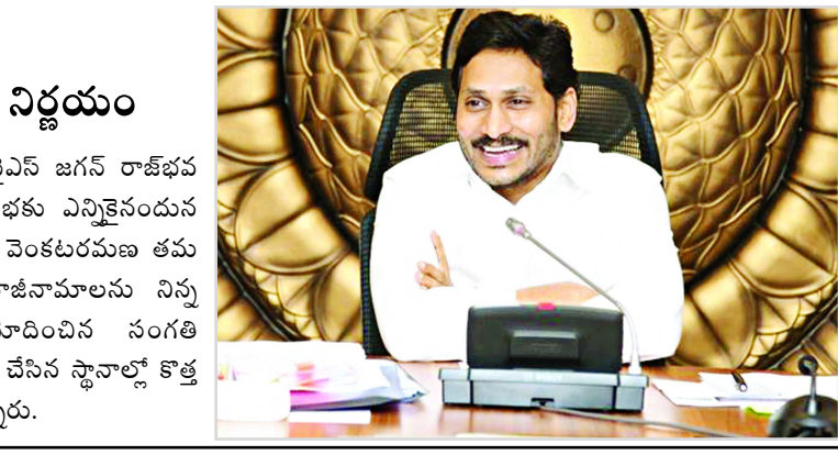
పూం ఒంటి గంటకు సీఎం వైఎస్ జగన్ రాజభవన్ నకు చేరుకోనున్నారు. రాజ్యసభకు ఎన్నికైనందున సుభాష్ చంద్రబోస్, మోసినేని వెంకటరమణ తమ మంత్రి పదవులకు చేసిన రాజీనామాలను సీఎం గవర్నర్ బిశ్వభూషణ్ ఆమోదించిన సంగతి తెలిసింది. వారు రాజీనామాలు చేసిన స్థానాల్లో కొత్త మంత్రులను నియమించనున్నారు.

అమరావతి: రాష్ట్ర మంత్రి వర్గ విస్తరణకు ముహూర్తం ఖరారైంది. నేడు మధ్యాహ్నం 1:29 నిమిషాలకు మంత్రివర్గ విస్తరణ జరగనుంది. రెండు ఖాళీ స్థానాలను భర్తీ చేయాలని ముఖ్యమంత్రి వైఎస్ జగన్మోహన్ రెడ్డి నిర్ణయం చారు. కొత్త మంత్రులతో గవర్నర్ బిశ్వ భూషణ్ హరిచందన్ ప్రమాణం చేయించనున్నారు. నేడు మధ్యా