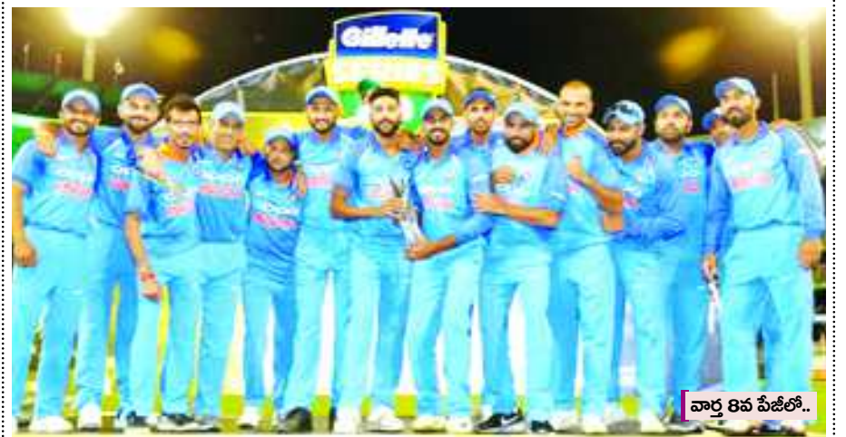
వార్త 8వ పేజీలో..