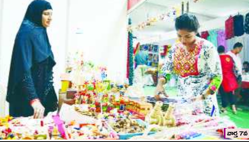
వార్షిక 7వ పేజీలో..