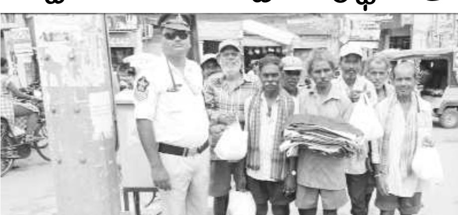
విజయనగరం : ట్రాఫిక్ పోలీసు స్టేషనులో పనిచేయుచున్న హెడ్ క్యానిస్టేబులు పట్టణంలోని మూడులాంతర్లు జంక్షన్ పరిసరాలలో సంచరిస్తున్న కొంత మంది పేద వృద్ధులకు భోజనం మరియు బట్టలను తే. శుక్రవారం సమకూర్చారు. విజయనగరం ట్రాఫిక్ హెడ్ క్యానిస్టేబులుగా పనిచేయుచూ, మూడులాంతర్లు వద్ద విధులు నిర్వహిస్తున్న ఎస్.నాగఅధికర్లు మూడులాంతర్లు పరిసరాల్లో ఆకలితో ఉన్న కొంత మంది వృద్ధుల్ని గుర్తించారు. వెంటనే, వారి