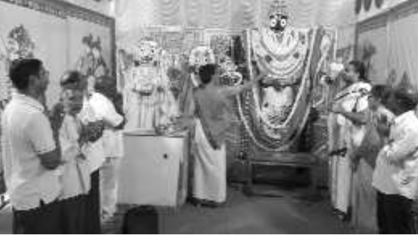
చోడవరం పట్టణంలోని బోళ్ళ వీధి రామాలయంలో..