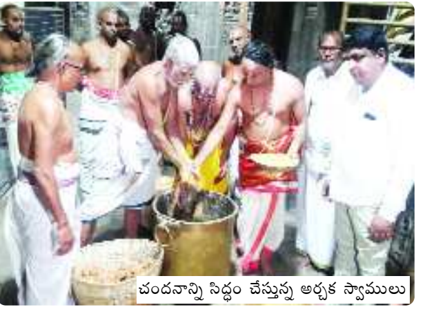
చందనాన్ని సిద్ధం చేస్తున్న అర్చక స్వాములు