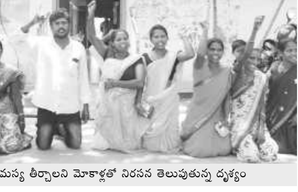
మంచినీటి సమస్య తీర్చాలని మోకాళ్లతో నిరసన తెలుపుతున్న దృశ్యం