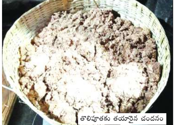
తొలిపూతకు తయారైన చందనం