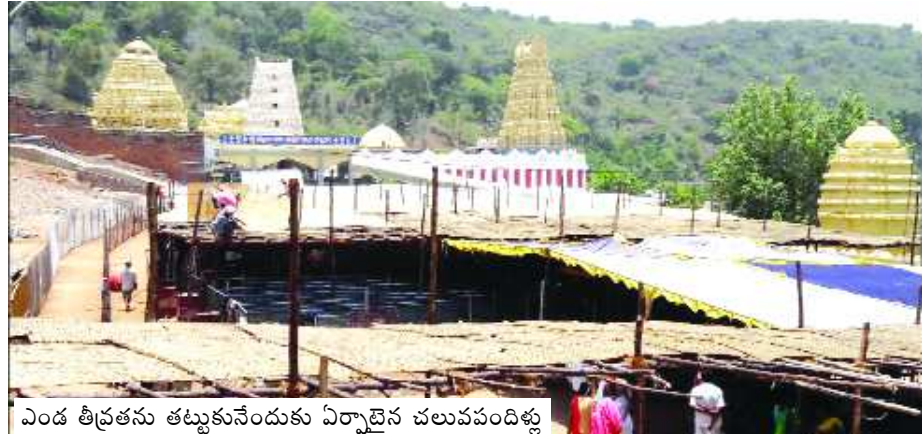
ఎండ తీవ్రతను తట్టుకునేందుకు ఏర్పాడిన చలువపందిళ్లు