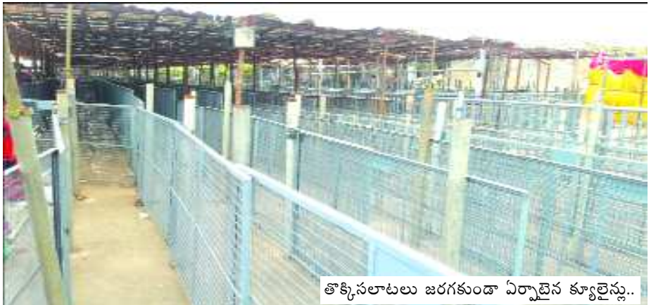
తోక్కినలాటలు జరగకుండా ఏర్పాడిన క్యూలైన్లు..