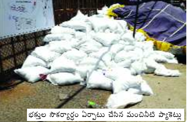
భక్తుల సౌకర్యార్థం ఏర్పాటు చేసిన మంచినీటి ప్యాకెట్లు