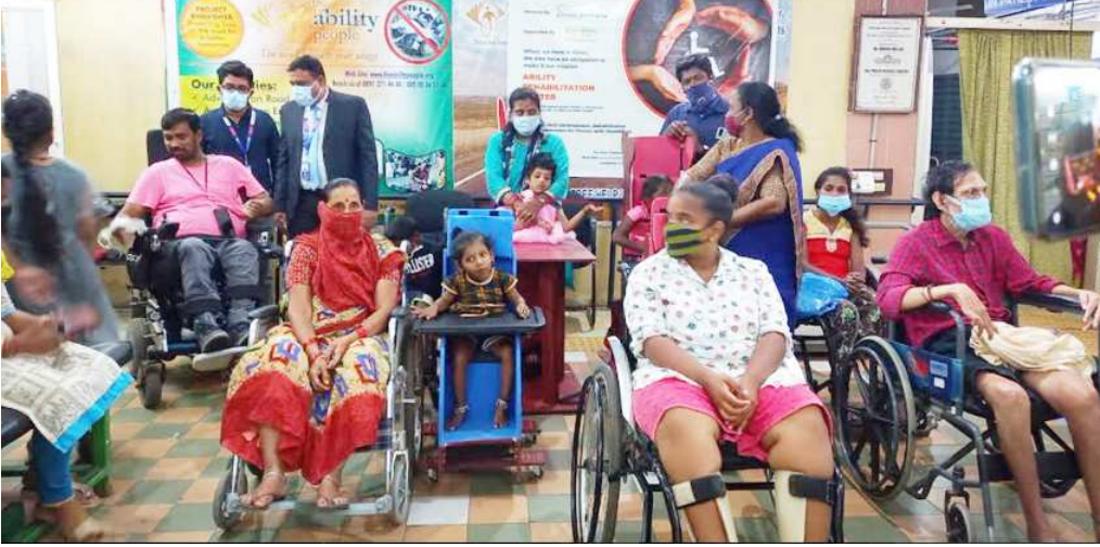
అయిన అమ్మాయికి వుట్టిన రోజు వేడుక అందరి సమక్షంలో జరిపించడం జరిగింది. ప్రత్యేక కుర్చీలు, మాడ్యూలర్ కిట్ కృత్రిమ అవయవాల అవసరం గలవారు ఈ ఫోన్ సంఖ్యకు సంప్రదించగలరు 8500365736.