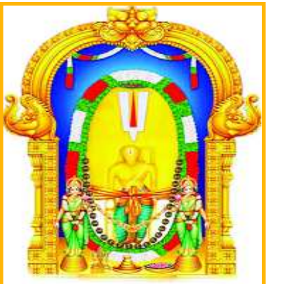
నింపనుంది. ఆషాఢ శుద్ధ చతుర్దశి నాడు ఏటా సింహవలంలో గిరిప్రదక్షిణ అనవాయితీగా

సింహవలం: సింహవలేశునికి భక్తులు గిరి ప్రదక్షిణ ద్వారా తమ మొక్కును చెల్లించుకునేందుకు రంగం సిద్ధమైంది. ఏటా ఆషాఢ శుద్ధ చతుర్దశి నాడు 32 కిలోమీటర్ల దూరం సింహ గిరులు చుట్టూరడం ద్వారా తమ గిరి ప్రదక్షిణను భక్తులు పూర్తి చేసుకుంటారు. భక్తుల కోలాహలంగా పాల్గొనే ఈ ఉత్సవం కోసం విశాఖలో ప్రధాన రహదారిపై ట్రాఫిక్ మళ్లిస్తారు. దాదాపు ఐదు లక్షల మంది భక్తులు గిరి ప్రదక్షిణలో పాల్గొంటారని అంచనా. ఆధ్యాత్మికం, ప్రకృతి పరిశీలన వంటి అంశాల మేళవింపుతో సముద్ర తీరం మీదుగా సాగే ఈ ప్రదక్షిణ వీరిలో కొత్త ఉత్సాహాన్ని