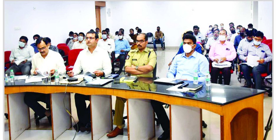
విశాఖపట్నం : ప్రభుత్వ, అభివృద్ధి, సంక్షేమ కార్యక్రమాలను వేగవంతం చేయాలని రాష్ట్ర ముఖ్యమంత్రి వై.యస్. జగన్ మోహన్ రెడ్డి జిల్లా కలెక్టర్లను ఆదేశించారు. జిల్లా కలెక్టర్లు,

వెస్.పి.లతో క్యాంప్ కార్యాలయం నుండి మంగళవారం వీడియో కాన్ఫరెన్స్ నిర్వహించారు. ఉపాధి హామీ పథకం, గ్రామ సచివాలయ భవనాలు, రైతు భరోసా కేంద్రాలు, డా. వై.ఎస్.ఆర్. హెల్త్ క్లినిక్ లు (గ్రామీణ), ఇళ్లపట్టాల పంపిణీ, ఇళ్ల నిర్మాణాల ప్రారంభం పురోగతి, నాడు - నేడు, స్కూల్స్, అంగన్ వాడీ కేంద్రాలు, మల్టీ పర్ఫార్మింగ్ వినియోగంపై భూ సేకరణ, వైద్య కళాశాలలు, రహదారులు, భవనాలు, వై.ఎస్.ఆర్. బీమా, జగన్మోహన్ రెడ్డి, వై.ఎస్.ఆర్. చేయూత మరియు వై.ఎస్.ఆర్ ఆసరా పురోగతి, రబీ ప్రాక్టర్ మెంట్, ఖరీఫ్ ప్రసరేషన్, జగన్మోహన్ రెడ్డి దీవెన, వాలంటీర్ సెనిలీటీస్, వాలంటీర్ ఫెలిసిటీషన్, తదితర అంశాలపై ఆయన వీడియో కాన్ఫరెన్స్