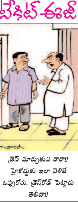
డ్రెస్ మార్పుకుని రారా!! హైకోర్టుకు జలా వెళితే ఒప్పుకోరు. డ్రెస్ కోట్ పెట్టారు తెలిదా!!