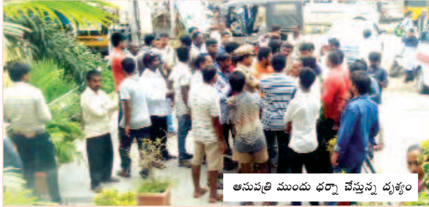
ఆసుపత్రి ముందు ధర్మా చేస్తున్న దృశ్యం

అనకాపల్లి : ప్రజల ఆరోగ్యాల కోసం కార్పోరేట్ ఆసుపత్రులు చెట్ల గాటం అడుతున్నాయి. వైద్యసేవలతో ప్రజల మన్ననలు పొందాల్సిన ఈ ఆసుపత్రులు వ్యాపార పరమాధిగా సాగిపోతున్నాయి. ప్రమాదాలు జరిగి కొన ప్రాణంతో ఆసుపత్రికి చేరిన క్షతగాత్రులకు తక్షణ వైద్యసాయం అందించకుండా ముందుగా డబ్బు చెల్లించండి తర్వాత చేర్పండి అని ఖరాఖండిగా చెబుతుండడం దిగజారిన వైద్యవిధానానికి నిదర్శనంగా చెప్ప వచ్చు. అనకాపల్లిలో కొన్ని ఆసుపత్రులు