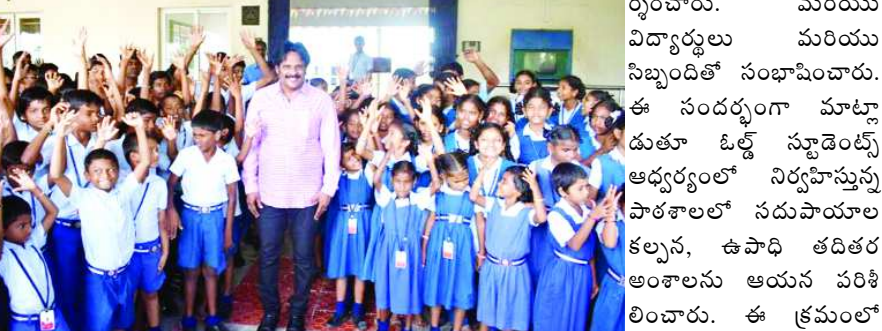
విశాఖపట్నం : ఎంపి ఎంపివి సత్యనారాయణ భోగాపురంలో కొరుకొండ సైనిక్ స్కూల్ ఓల్డ్ స్టూడెంట్స్ నిర్వహిస్తున్న చెవిటి, మూగ మరియు వికలాంగ పాఠశాలను సందర్శించారు.

విశాఖ యంపీ ఎంపివి సత్యనారాయణ ర్పించారు. మరియు విద్యార్థులు మరియు నిబ్బందితో సంభాషించారు. ఈ సందర్భంగా మాట్లాడుతూ ఓల్డ్ స్టూడెంట్స్ అధ్యక్షులలో నిర్వహిస్తున్న పాఠశాలలో సదుపాయాల కల్పన, ఉపాధి తదితర అంశాలను ఆయన పరిశీలించారు. ఈ క్రమంలో సంతృప్తిని వ్యక్తం చేస్తూ నిర్వాహకులను అభినం దించారు. పాఠశాల అభివృద్ధికి తన తోడ్పాటుని అందజేస్తానని హామీనిచ్చారు.