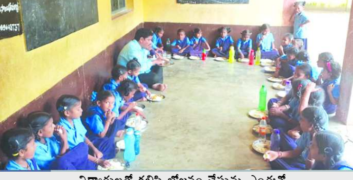
విద్యార్థులతో కలిసి భోజనం చేస్తున్న ఎంఈవో