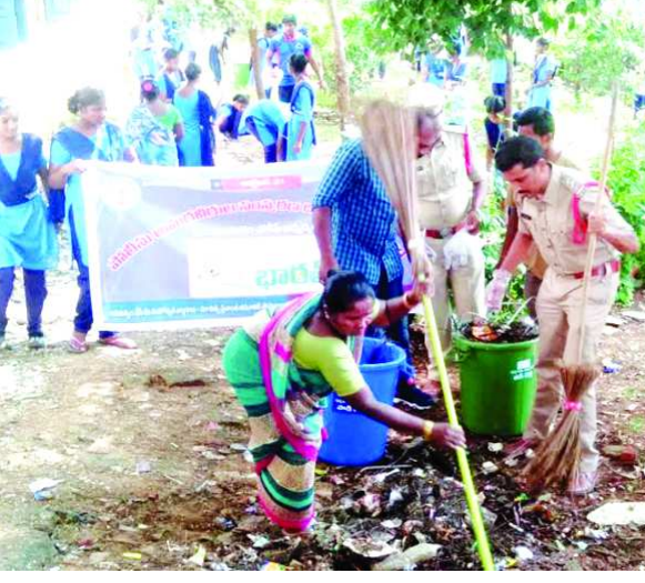
మధురవాడ, మహావిశాఖ నాలుగో వార్డ్ పరిధి మధురవాడ చంద్రంపాలెం జిల్లా పరిషత్ ఉన్నత పాఠశాలలో అమరవీరుల సంస్మరణ వారోత్సవాలు