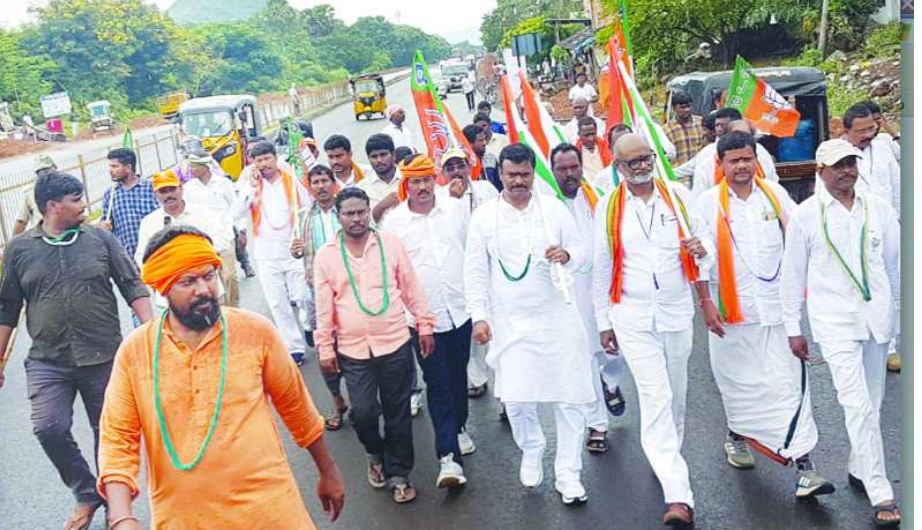
గురువారం నక్కపల్లిలో పాదయాత్ర కొనసాగింది. దీనంలో వివిధ జిల్లాల నుండి సీనియర్ నాయకులు మరియు కార్యకర్తలు తదితరులు పాల్గొన్నారు.

విశాఖపట్నం : ప్లాస్టిక్ కవర్ల వాడకం మానేద్దాం! పర్యావరణాన్ని కాపాడు కుందాం అనే ఉద్దేశ్యంతో మొదలు పెట్టిన 'సంకల్ప యాత్ర' రెండవరోజు గురువారం నక్కపల్లి మండలంలో జరి గింది. దానిలో భాగంగా ప్రజలకు మరియు బాలయోగి ఆశ్రమ పాఠశాల విద్యార్థినిలకు ప్లాస్టిక్ వాడకం వలన జరిగే దుష్ప్రభావాలు గురించి మరియు మొక్కలు పెంచడం వలన జరిగే ఉపయోగాలు గురించి వివరించడం జరిగింది. అదే విధంగా స్కూల్లో మొక్కలు నాటడమే కాకుండా అధ్యాపకులకు మొక్కలు పంపిణీ చేయడం జరిగింది. అ యాత్రను మన ప్రయత్నం గాంధీజీ 150వ జయంతి సందర్భంగా 150 కిలోమీటర్లు పాదయాత్ర చేయడంలో భాగంగా