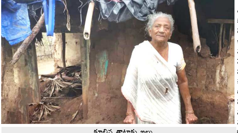
కూలిన తాటాకు ఇల్లు