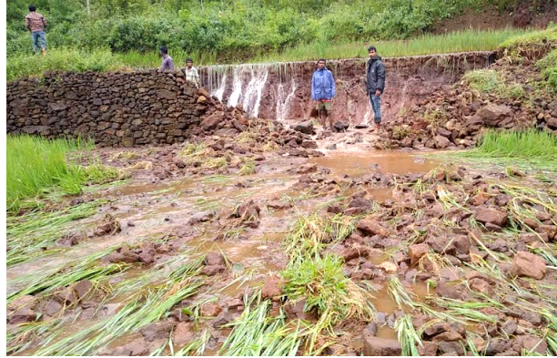
తడి ఏర్పడింది. ప్రభుత్వం సప్లయైన రైతులకు ఆదుకోవాలని మనమే నష్టపరిహారం చెల్లించాలని రైతులు వాపోతున్నారు.