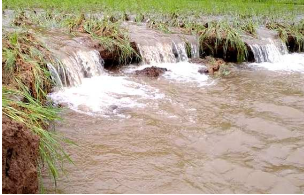
అరకులోయ : మండలంలోని బొంబం పంచాయతీ పరిధిలో గల గ్రామాల్లో నివాస గృహాలు పంట పొలాలు నేలమట్ట మయ్యాయి. కురిసిన భారీ వర్షం రైతులకు చెప్పు లేనంత కంట