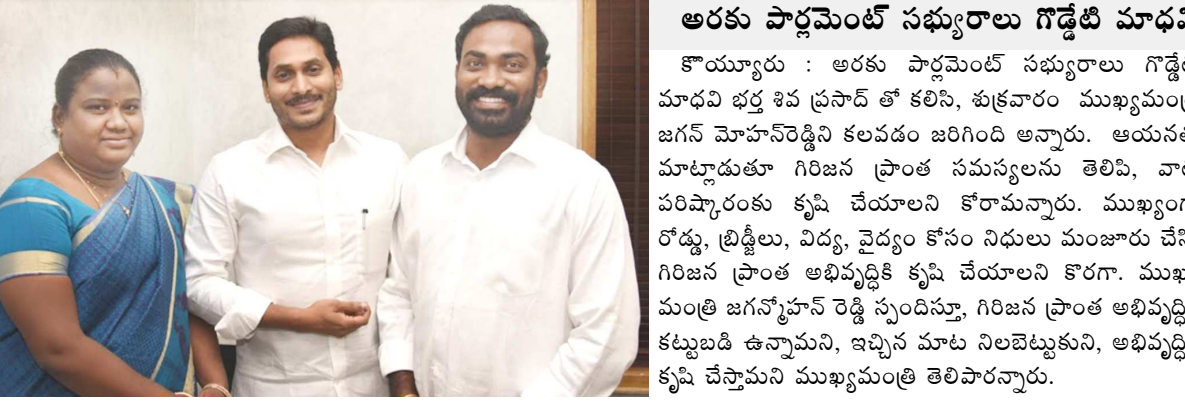
అరకు పార్లమెంట్ సభ్యులూ గొడ్డేటి మాధవ్