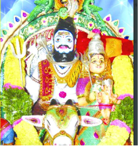
సహకారాలతో ఉత్సవంను అత్యంత వైభవంగా నిర్వహిస్తున్నట్లు కమిటీ సభ్యులు తెలిపారు.

చోడవరం : మండలంలోని అంభేరుపురం గ్రామంలోని గౌరీపరమేశ్వరుల అనుపు మహోత్సవం నేడు(శనివారం)అత్యంత వైభవంగా నిర్వహించనున్నట్లు అలయ ఉత్సవ కమిటీ సభ్యులు తెలిపారు. ఉత్సవంలో భాగంగా గ్రామంలోని వీధులు, ప్రధాన రహదారులను విద్యుత్ దీపాలతో ప్రత్యేకంగా అలంకరించారు. ఉదయం సుంచి గౌరీపరమేశ్వరులకు విశేష పూజలతో పాటు, సాంస్కృతిక కార్యక్రమాలలో భాగంగా ఎం.వి.ఆర్ ఆర్కాడ్డా, డాన్స్ హంగామా, బిస్కెట్ చిదతలు, కోలాటం, తీస మార, చాలనాగమ్మ బుర్రకడ, ధీ జోడి డ్యాన్స్ వేదిక డాన్స్, రంగస్థలం డాన్స్, రేలారేలారా, తదితర కార్యక్రమాలు ఉంటాయన్నారు. అంభేరుపురం, గోవాడ గ్రామ ప్రజలు, పెద్దలు, స్థానిక యువత, మగ్గర్ ఫ్యాక్షర్ల కొమ్మలు, రైతుల సహాయ