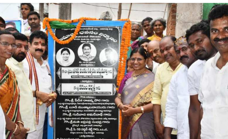
అడ్డూరులో సామాజిక భవన నిర్మాణానికి శిలాఫలకం ఆవిష్కరిస్తున్న ఎంపీ సత్యవతి, ప్రభుత్వ విప్లు కరణం ధర్మశ్రీ