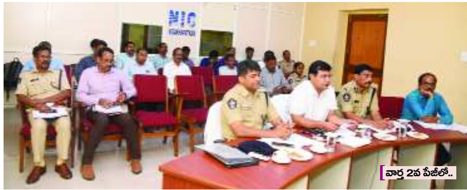
వార్ 2వ సీట్లో.