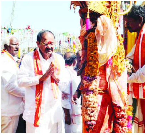
సమ్మక్క, సారలమ్మను దర్శించుకున్న కేసీఆర్ వారి బుద్ధి మార్చాలని కోరుకున్నా.. కుంభమేళాకు 200 నుంచి 300 ఎకరాల సేకరణ! మేడారంలోని సమ్మక్క, సారలమ్మ అమ్మవార్లను తెలంగాణ ముఖ్యమంత్రి కేసీఆర్ శుక్రవారం దర్శించుకున్నారు. కుటుంబ సమేతంగా అలయానికి చేరుకున్న కేసీఆర్ కు ఉపముఖ్యమంత్రి కడియం శ్రీహరి తదితరులు స్వాగతం పలికారు. అనంతరం కేసీఆర్ గద్దెల వద్దకు చేరుకుని అమ్మవార్లకు తరువాయి 2లో