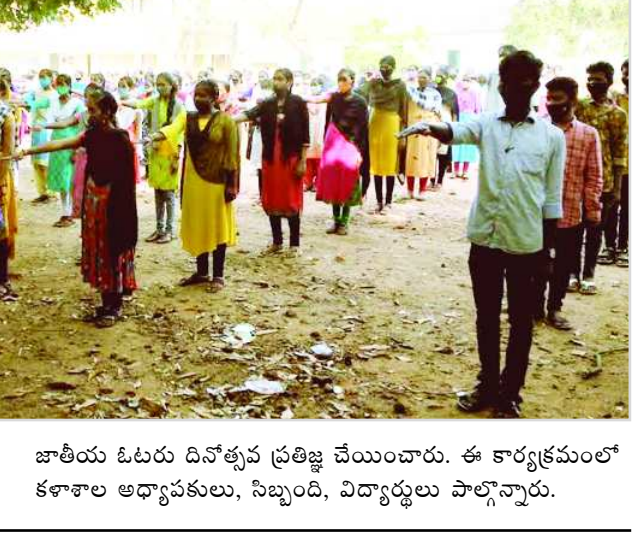
జాతీయ ఓటరు దినోత్సవ ప్రతిజ్ఞ చేయించారు. ఈ కార్యక్రమంలో కళాశాల అధ్యాపకులు, సిబ్బంది, విద్యార్థులు పాల్గొన్నారు.