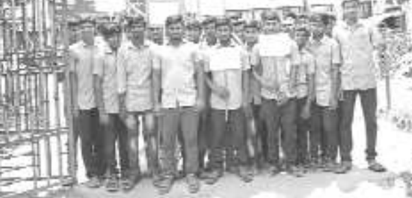
నర్సీపట్నం : జటివ పరీక్షలు అన్లైన్ పరీక్షలు రద్దు చేయాలని నర్సీపట్నం భూషణ్ జటివ విద్యార్థులు గురువారం నర్సీపట్నం ఆర్టీవో కార్యాలయం వద్ద ఆందోళన చేశారు. ముందుగా పెండ్లవేళ్లపల్లి జటివ కళాశాల నుంచి ర్యాల్లిగా నర్సీపట్నం ఆర్టీవో కార్యాలయం వద్దకు చేరుకొని అక్కడ ధర్మా చేశారు. ఈ సందర్భంగా విద్యార్థులు మాట్లాడుతూ పాలిటెక్నిక్, డిగ్రీ, ఇంజనీరింగ్ విద్యార్థులకులేని అన్లైన్ పరీక్షలను జటివ విద్యార్థులకు నిర్వహించడం తగదన్నారు. అన్లైన్ పరీక్షలపై తమకు ఎటువంటి అవగాహన లేనందున ఇబ్బందులు పడతామన్నారు. కావున పరీక్షలను అన్లైన్లోనే నిర్వహించాలని కోరారు. ఈ కార్యక్రమంలో భూషణ్ జటివ అధ్యక్షులు, విద్యార్థులు పాల్గొన్నారు.