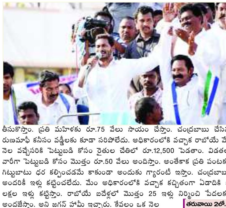
తీసుకొస్తాం. ప్రతి మహిళకు రూ.75 వేలు సాయం చేస్తాం. చంద్రబాబు చేసిన రుణమాఫీ కనీసం వడ్డీలకు కూడా సరిపోలేదు. అధికారంలోకి వచ్చాక రాబోయే మే నెల వచ్చేసరికి పెట్టుబడి కోసం రైతుల చేతిలో రూ.12,500 పెడతాం. విడతల వారీగా పెట్టుబడి కోసం మొత్తం రూ.50 వేలు అందిస్తాం. అంతేకాక ప్రతి పంటకు గిట్టుబాటు ధర కల్పించడమే కాకుండా అందుకు గ్యారంటీ ఇస్తాం. చంద్రబాబు అందరికీ ఇళ్లు కట్టించలేదు. మేం అధికారంలోకి వచ్చాక కచ్చితంగా ఏడాదికి 5 లక్షల ఇళ్లు కట్టిస్తాం. రాబోయే ఐదేళ్లలో మొత్తం 25 లక్షల ఇళ్లు నిర్మించి పేదలకు అందజేస్తాం. అని జగన్ హామీ ఇచ్చారు. కేవలం ఒక నెల తరువాయి 2లో..

ఐదేళ్లలో 25 లక్షల ఇళ్లు కట్టిస్తాం వైకాపా అధ్యక్షుడు జగన్ హామీ వినుకొండ (గుంటూరు): చంద్రబాబు ఇచ్చే రూ.3 వేలకు మోసపోవడం, 20 రోజుల్లో వైకాపా అధికారంలోకి వస్తుందని ఆ పార్టీ అధ్యక్షుడు జగన్ ధీమా వ్యక్తం చేశారు. అధికారంలోకి వచ్చాక పిల్లలకు ఉచిత విద్య అందిస్తామని హామీ ఇచ్చారు. ఉన్నత చదువులు సైతం ఉచితంగా చదివిస్తామని చెప్పారు. గుంటూరు జిల్లా వినుకొండలో జగన్ రోడ్ షో నిర్వహించారు. చంద్రబాబు అధికారంలోకి వచ్చాక సున్నా వడ్డీలతో రుణాలు ఇవ్వలేదు. ఇది ప్రతి పాదుపు సంఘాల మహిళలు గుర్తించాలి. ఎన్నికల తేదీ వరకూ ఎన్ని రుణాలుంటాయో అన్నీ నాలుగు దఫాలుగా మళ్ళీ మీ చేతుల్లోనే పెడతా. 45 నుంచి 60 ఏళ్ల వయసు ఉన్న ప్రతి ఒక్కరి కోసం వైఎస్ఆర్ చేయూత అనే పథకం