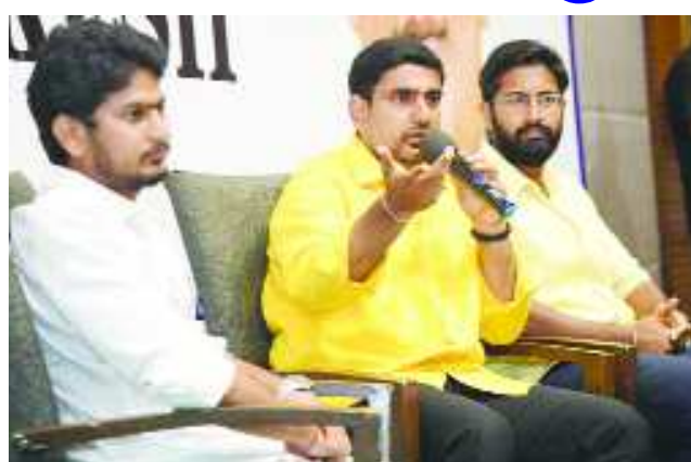
పారిశ్రామికాభివృద్ధితో ఆర్థికాభివృద్ధి రాష్ట్ర ఐటీ శాఖ అవధ్యర్య మంత్రి నారా లోకేశ్ విశాఖ సిటీ: ఇప్పటికే విశాఖను అభివృద్ధి దిశగా పరుగులు పెట్టించామని, తాము అధికారంలోకి వస్తే విశాఖలో పారిశ్రామికాభివృద్ధికి మరింత కృషి చేయడం తరువాయి 2లో..