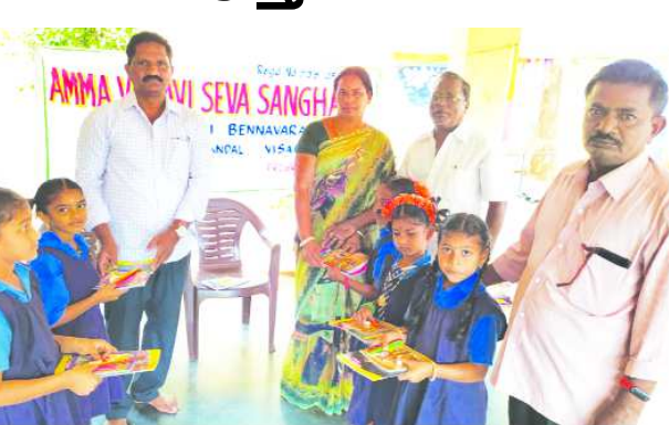
నోటు పుస్తకాలు అందజేస్తున్న దృశ్యం