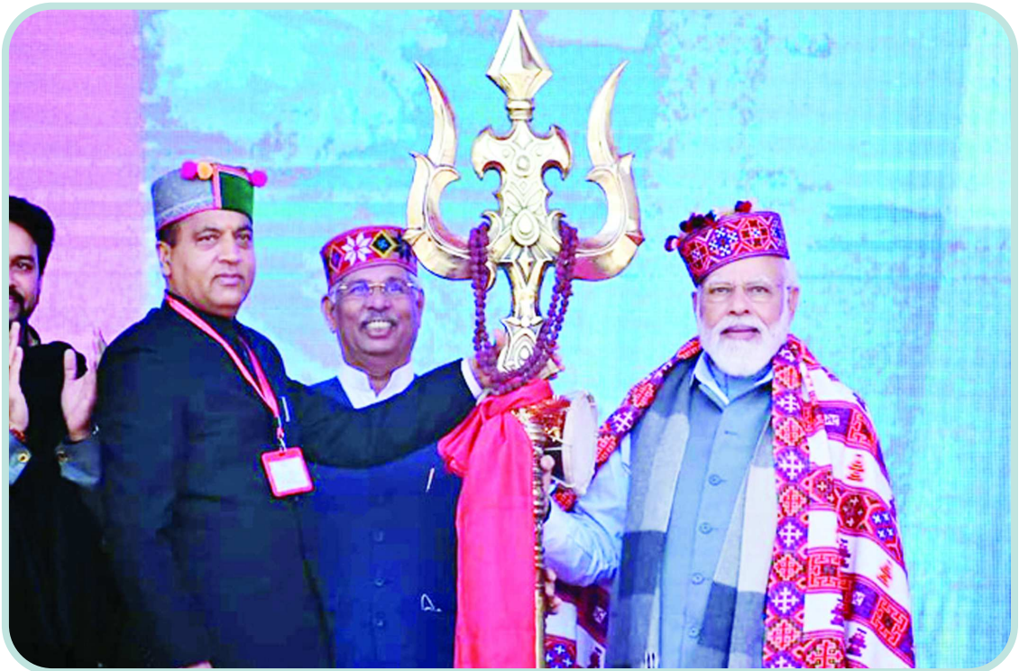
ప్రధాని నరేంద్ర మోదీ సోమవారం హిమాచల్ ప్రదేశ్లో వివిధ అభివృద్ధి కార్యక్రమాలను ప్రారంభించారు. ఈ సందర్భంగా పార్టీ నేతలు ఆయనకు త్రిశూలాన్ని బహూకరించారు. అనంతరం ప్రధాని మాట్లాడుతూ.. దేశంలోని పంచ కైలాస పర్వతాల్లో.. మూడు హిమాచల్ ప్రదేశ్లోనే ఉన్నాయని తెలిపారు. ఈ రాష్ట్రంలో శివుడు శక్తి కొలువై ఉన్నారని చెప్పారు.