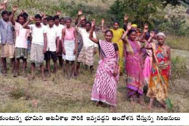
సాగు చేసుకుంటున్న భూమిని అటవీశాఖ వారికి ఇవ్వవద్దని ఆందోళన చేస్తున్న గిరిజనులు