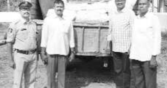
పట్టుబడిన గంజాయి వాహనంతో కేడిపేట పోలీసులు