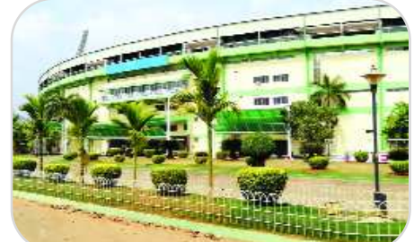
మధురవాడ : విశాఖ వైఎస్సార్ అంతర్జాతీయ క్రికెట్ స్టేడియంలో ఫిబ్రవరి 24న భారత్ - ఆస్ట్రేలియా జట్ల మధ్య జరగబోవు అంతర్జాతీయ టి-20 మ్యాచ్ కు విశేష స్పందన

లభిస్తోంది. క్రికెట్ అభిమానులు టికెట్ల కోసం బారులు తీరారు, ఈనెల 15 నుంచి ఆఫ్ లైన్ లో క్రికెట్ స్టేడియంలో పాటు సగరంలోని పలు కేంద్రాలలో 500, 1200, 1600, 2000, 4000, 5000 ధరలు గల టికెట్ల విక్రయాలు ప్రారంభించారు.