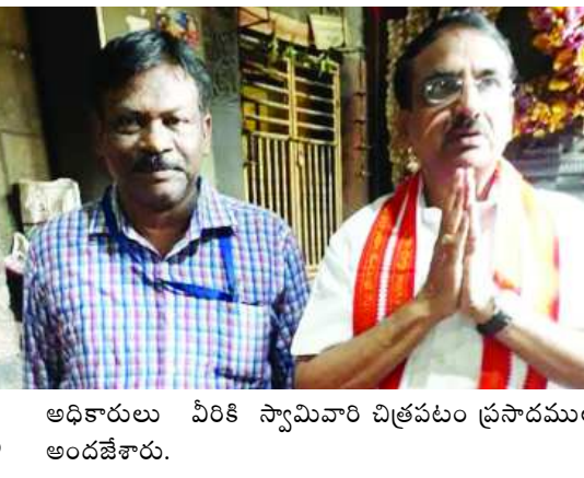
అధికారులు వీరికి స్వామివారి చిత్రవటం ప్రసాదములు అందజేశారు.