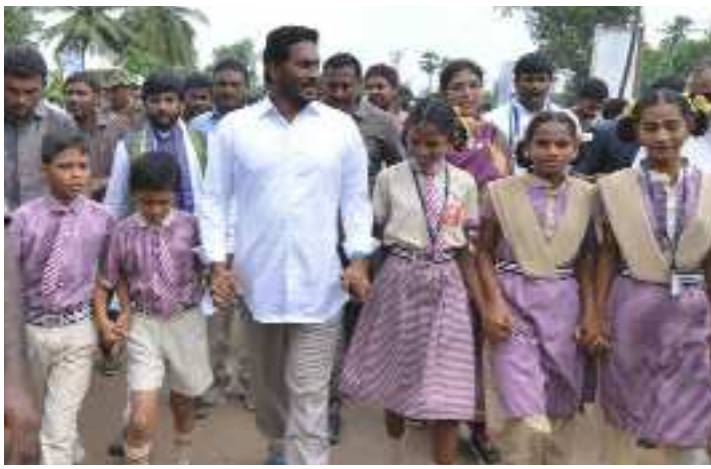
ప్రజాసంకల్పయాత్రలో భాగంగా 2,904.3 కిలోమీటర్లు నడిచారు.

పెండుర్తి: ప్రజలతో మమేకమై వారి సమస్యలు తెలుసుకుని.. వారిలో భరోసా నింపేందుకు వైఎస్సార్ కాంగ్రెస్ పార్టీ అధ్యక్షుడు, ప్రతిపక్ష నేత వైఎస్ జగన్మోహన్ రెడ్డి చేపట్టిన ప్రజాసంకల్పయాత్ర విశాఖపట్నం జిల్లాలో దిగ్విజయంగా కొనసాగుతోంది. జననేత 256వ రోజు పాదయాత్రను గురువారం ఉదయం పెండుర్తి నియోజకవర్గం చిన్నగొల్లపాలెం క్రాస్ నుంచి ప్రారంభించారు. అక్కడి నుంచి అమృతాపురం, ఇప్పవనిపాలెం మీదుగా జెర్రిపాతుల పాలెం వరకు నేటి పాదయాత్ర కొనసాగుచుంది. తమ బతుకుల్లో నష్టాల పువ్వులు విరిసేలా చేయాలన్న సంకల్పంతో సుదీర్ఘ పాదయాత్ర సాగిస్తున్న జనపథికుడిను కలిసేందుకు ఉదయం నుంచే పెద్ద ఎత్తున అభిమానులు, పార్టీ కార్యకర్తలు, ప్రజలు వైట్ క్యాంప్ కు తరలివచ్చారు. జననేత సంకల్ప సిద్ధి విజయవంతం కావాలని ఆకాంక్షిస్తూ స్థానిక ప్రజలు సర్వమత ప్రార్థనలు జరిపించారు. ప్రజాసమస్యలు తెలుసుకుంటూ.. వారికి నేనున్నా అని భరోసానిస్తూ వైఎస్ జగన్ పాదయాత్రలో అడుగులు ముందుకు వేస్తున్నారు. ఇప్పటివరకు జననేత