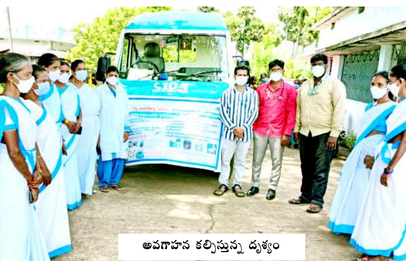
అవగాహన కల్పిస్తున్న దృశ్యం