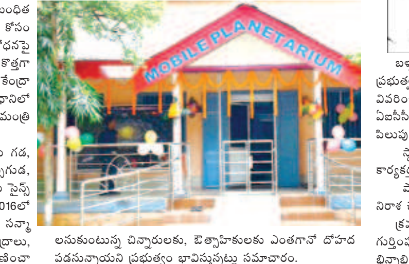
లనుకుంటున్న చిన్నారిలకు, ఔత్సాహికులకు ఎంతగానో దోహదపడనున్నాయని ప్రభుత్వం భావిస్తున్నట్లు సమాచారం.

రాయగడ : రాష్ట్రంలో సైన్స్, అంతరిక్ష విజ్ఞానానికి సంబంధిత అంశాలపై పరిజ్ఞానం పెంపొందించుకోవాలన్న ఔత్సాహికుల కోసం ఒడిశా ప్రభుత్వం చొరవ చూపుతోంది. శాస్త్రీయ పరిశోధనపై ప్రత్యేక దృష్టి సారించింది. ఇందులో భాగంగా రాష్ట్రంలో కొత్తగా మూడుచోట్ల ప్లానిటోరియంలతోపాటు అయిదుచోట్ల సైన్స్ కేంద్రాలను ఏర్పాటు చేస్తున్నట్లు నవీన్ సర్కార్ పేర్కొంది. రాజధానిలో జరిగిన ఒడిశా విజ్ఞాన అకాడమీ సన్మాన సభలో ముఖ్యమంత్రి నవీన్ పట్నాయక్ ఈ విషయాన్ని వెల్లడించడం గమనార్హం. ఈ సందర్భంగా మాట్లాడిన నవీన్ గోపాలపూర్, రాయ గడ, బరిపడలో ప్లానిటోరియంల ఏర్పాటుతోపాటు రూపొందించడం, కేంద్రుర్, గోపాలపూర్, కేంద్రపడ, జయపురంలలో అయిదు సైన్స్ కేంద్రాలను ప్రారంభించనున్నట్లు చెప్పడం విశేషం. 2015, 2016లో ఒడిశా విజ్ఞాన అకాడమీ 28 మంది ఒడియా శాస్త్రవేత్తలను సన్మానించినట్లు విశ్వసనీయ సమాచారం. ఇప్పటికే కొత్త సైన్స్ కేంద్రాలు, ప్లానిటోరియంలు సైన్స్, పరిశోధనా రంగాల్లో రాజీంచా