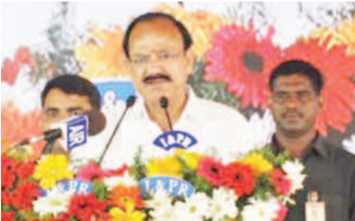
పరిరక్షించాలని ఇరు రాష్ట్ర ప్రభుత్వాలకు సూచించారు. ఆంధ్రప్రదేశ్ ప్రభుత్వం తరఫున నిర్వహించిన పౌర సన్మాన కార్యక్రమంలో ఆయన పాల్గొని తరువాయి 2లో