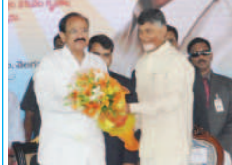
పరిరక్షించాలని ఇరు రాష్ట్ర ప్రభుత్వాలకు సూచించారు. ఆంధ్రప్రదేశ్ ప్రభుత్వం తరఫున నిర్వహించిన పౌర సన్మాన కార్యక్రమంలో ఆయన పాల్గొని తరువాయి 2లో

అమరావతి: తెలుగు రాష్ట్రాల ముఖ్యమంత్రులు కలహించుకోకుండా కలిసి మెలిసి పనిచేయాలని ఉప రాష్ట్రపతి వెంకయ్యనాయుడు అన్నారు. తెలుగు రాష్ట్రాలు అభివృద్ధి చెందాలన్నదే తన ఆకాంక్ష అని చెప్పారు. తెలుగు భాషను