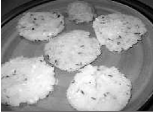
కావల్సిన పదార్థాలు: రవ్వలా కొట్టిన బియ్యపు పిండి - రెండు కప్పులు, శనగపప్పు - అర కప్పు, నెయ్యి - ఒక స్పూన్, ఉప్పు, నీళ్లు - తగినంత.

తయారుచేయు విధానం: ముందుగా రాత్రిపూటే బియ్యం నానబెట్టుకొని తెల్లారాక మిక్సీలో రవ్వలా వేసుకోవాలి. అలాగే శనగలను 15 నిమిషాలపాటు నానబెట్టుకోవాలి. తర్వాత స్టా మీద మందపాటి గిన్నె పెట్టి వేడయ్యాక, అందులో స్పూన్ నెయ్యి వేసి శనగపప్పును వేసి కొద్దిగా వేగనివ్వాలి. శనగపప్పు వేగాక వెంటనే నీళ్ళు పోసి మరగనివ్వాలి. అందులో తగిన ఉప్పు వేసి, ఆ తర్వాత బియ్యపు పిండిని వేసి ఉండలు లేకుండా కలియబెట్టుకోవాలి. వెంటనే మూతపెట్టి 4-5 నిమిషాలు ఉక్కిరిపట్టాలి. సీరంతా పిండి పీల్చేసుకున్నాక స్టా మీద నుంచి దించేసుకోవాలి. ఆ పిండితో నచ్చిన సైజులో ఉండలు చేసుకోవాలి. వీటిని ఇడ్లీ ప్లేట్లలో పెట్టి 25 నిమిషాలు ఆవిరిపై ఉడకనివ్వాలి. అంతే కుడుములు రెడి.