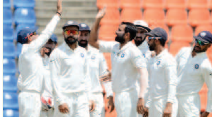
సాధించాడు. ఇక ఒకే ఓవర్లో మూడు వరుస సిక్సర్లు కొట్టడం మూడు నెలల్లో పాండ్యాకి మూడోసారి. చాంపియన్స్ ట్రోఫీ ఫైనల్లో పాకిస్తాన్పై రెండు ఓవర్లలో వరుసగా మూడేసి సిక్సర్లు బాదాడు. ఇక ఎనిమిదో స్థానంలో ఆడుతూ.. అత్యంత వేగంగా సెంచరీ చేసిన ఇండియన్ బ్యాట్స్ మన్ గానూ పాండ్యా నిలిచాడు.

కాండీ: హార్దిక్ పాండ్యా.. ఇన్నాళ్లూ వస్తేలు, టీ20లకే పరిమితమైన ఈ హార్డ్ హిట్టర్ ఇప్పుడు టెస్ట్ క్రీకెట్లోనూ తనదైన మార్క్కు చూపించాడు. శ్రీలంకతో మూడో టెస్ట్ తొలి ఇన్నింగ్స్లో అతను విశ్వరూపం చూపించాడు. ఆడుతున్నది టెస్ట్ మ్యాచ్ అయినా.. టీ20 స్టైల్లో చెలరేగాడు. కేవలం 86 బంతుల్లోనే టెస్ట్లో తొలి సెంచరీ చేశాడు పాండ్యా. అందులో 7 సిక్సర్లు, 8 ఫోర్లు ఉన్నాయి. ఈ క్రమంలో మరో అరుదైన రికార్డును అందుకున్నాడతడు. తొలి గంటలోనే మూడు వికెట్లు తీసి ఊపు మీదున్న లంక బౌలర్లకు దిమ్మడిరిగి షాకిచ్చాడు పాండ్యా. ముఖ్యంగా స్పిన్ల సందక్ష్ణ బౌలింగ్లో చెలరేగి ఆడాడు. ఒకే ఓవర్లో ఏకంగా 26 రన్స్ చేశాడు. టెస్ట్ క్రీకెట్లో ఒక ఓవర్లో అత్యధిక పరుగులు చేసిన భారత బ్యాట్స్ మన్ గా రికార్డు సృష్టించాడు పాండ్యా.