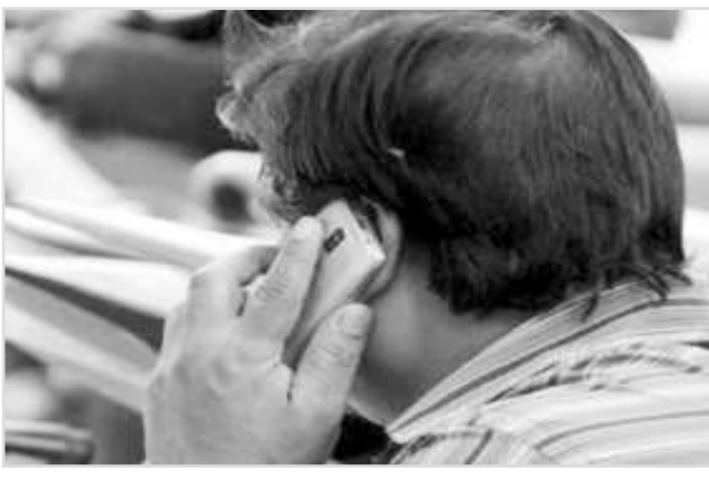
ఐసీయూ అంటే మొబైల్ ఆపరేటర్లు కోరుతున్నారు. మొబైల్ పరిశ్రమ ఇంటర్నెట్ ప్రాబ్లం మోడల్స్ మారుతున్న క్రమంలో ఈ ఛార్జీల వసూలు అర్థరహితమని జియో వాదిస్తోంది.

న్యూఢిల్లీ : కాలే ఛార్జీలు, డేటా ప్యాక్ల ధరలు దిగివస్తున్న క్రమంలో మొబైల్ వినియోగదారులకు డిజిటల్ రెగ్యులేటరీ ట్రాయ్ మరో తీవ్రమైన అందించింది. ఇంటర్నెట్ యూసేజ్ ఛార్జీల(ఐసీయూ)ను తగ్గించేందుకు ట్రాయ్ కనీసం 10 పైసలకు తగ్గించనున్నారు. గత ఏడాది సెప్టెంబర్ లో రిలయన్స్ జియో రాకతో మొబైల్ టారిఫ్లు ప్రభావితమైన క్రమంలో ఐసీయూ వసూలు కీలక అంశంగా ముందుకొచ్చింది. కస్టమర్లకు ఉచిత కాలి అందించే క్రమంలో ఇంటర్నెట్ యూసేజ్ ఛార్జీలతో జియోపై పెనుభారం పడింది. ఈ ఛార్జీలను పూర్తిగా తొలగించాలని రిలయన్స్ జియో కోరుతుండగా, వీటిని మరింత పెంచాలని ఎయర్ టెల్, వొడాఫోన్,