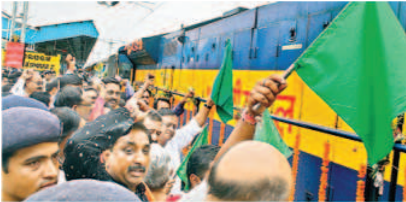
నెరవేరిందని ఎంపీలు తెలిపారు. దీని వల్ల అలహాబాద్ లోని త్రివేణి సంగమం, అమృతసర్ సర్క మందిరం, అమర్ నాథ్ వెళ్ల దలచిన యాత్రికులకు ఎంతో మేలు జరుగుతుందని హర్షం వ్యక్తం చేశారు.