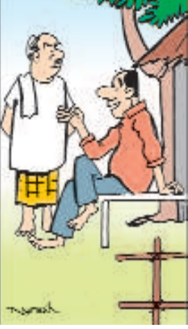
పాదయాత్రల తొకీడి ఉండేలాఉంది... వాగ్దానాలు కురిపిస్తారు.. నాయకులతో కాస్త జాగ్రత్త !!