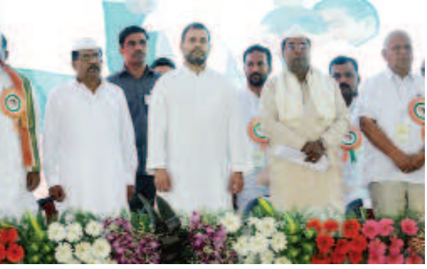
రైతులు ఎలా సోమరులవుతారని రాహుల్ ప్రశ్నించారు. ఈ కార్యక్రమంలో సీఎం సిద్ధరామయ్య, లోక్ సభలో కాంగ్రెస్ పక్ష నేత మల్లికార్జున ఖర్గే తదితరులు పాల్గొన్నారు.

న్యూఢిల్లీ : ప్రధాని నరేంద్రమోదీ సారథ్యంలోని బీజేపీ ప్రభుత్వం తప్పుడు హామీలతోనే కాలం గడుపుతున్నదని కాంగ్రెస్ పార్టీ ఉపాధ్యక్షుడు రాహుల్ గాంధీ ఆరోపించారు. రైతులు, నిరుద్యోగుల సమస్యలను పట్టించుకోవడం లేదన్నారు. యూపీఏ ప్రభుత్వ హయాంలో వెనుకబడిన హైదరాబాద్ కర్ణాటక ప్రాంతానికి ప్రత్యేక హోదా కల్పిస్తూ రాజ్యాంగంలో 371 (జే) అధికరణానికి సవరణలో కీలక పాత్ర పోషించిన రాహుల్ గాంధీని కర్ణాటక ప్రదేశ్ కాంగ్రెస్ కమిటీ నన్యానించింది. ఈ సందర్భంగా ఆయన మాట్లాడుతూ.. కేంద్ర ఆర్థిక మంత్రి అరుణ్ జైట్లీ పంట రుణాల మాఫీ తమ ప్రభుత్వ పాలన కారణం, రైతులను సోమరులను చేయడంపై అన్నారు రాహుల్ గుర్తు చేశారు. ఇదే ప్రభుత్వం పారిశ్రామిక రుణాలు మాఫీ చేసినప్పుడు 10 మంది అత్యంత సంపన్న పారిశ్రామికవేత్తలు సోమరులు కావచ్చుడు