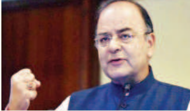
అది పాక్ అసంపూర్తి ఎజెండా. దానికి దీరైన జవాబు ఇండియా ఇస్తూనే ఉంది. 1965, 1971, కాఫీల్ యుద్ధమే ఇందుకు నిదర్శనం' అని జైట్లీ అన్నారు. కాగా, డోక్లాం వ్యవహారంలో భారత్, చైనా మధ్య తలెత్తిన ప్రతిఘటనపై మాట్లాడేటప్పుడు జైట్లీ సంయుక్తం కనబరచారు. 'మన భద్రతా బలగాలపై పూర్తి విశ్వాసం ఉంచుదాం' అని ముక్తసరిగా సమాధానమిచ్చారు.

న్యూఢిల్లీ: కశ్మీర్లో ఉగ్రవాదులు ఇప్పుడు తీవ్ర ఒత్తిడిలో ఉన్నారు. పెద్ద నోట్ల రద్దు, విదేశీ నిధులపై జాతీయ దర్భాష సంస్థ (ఎన్ఐఐ) పెద్దవిత్తున దాడులు జరుపుతుండటంతో తీవ్ర నిధుల కొరతను ఎదుర్కొంటున్నారని కేంద్ర రక్షణ శాఖ మంత్రి అరుణ్ జైట్లీ అన్నారు. ఆదివారంనాడిక్కడ జరిగిన ఓ కార్యక్రమంలో జైట్లీ మాట్లాడుతూ, ఇవాళ ఏ పెద్ద ఉగ్రవాది కూడా కశ్మీర్లో ఉగ్రకార్యకలాపాలకు, ప్రజలను భయభ్రాంతులను చేయడానికి సాహసించే పరిస్థితి లేదని, కొద్దిరోజులుగా వారి మనుగడే ప్రమాదంలో పడిందని చెప్పారు. ఉగ్రవాదులను ఏరివేసేందుకు జమ్మూకశ్మీర్ ప్రజలు శక్తివంతులనైతే కుండా పనిచేస్తున్నారని ప్రశంసించారు. మన దేశం రెండు విధాలైన ముప్పును ఎదుర్కొంటోందని, వీటిలో ఒకటి జమ్మూకశ్మీర్ సరిహద్దు వెంబడి జరుగుతున్న ఘటనలు కాగా, వాపపక్ష తీవ్రవాదం మరొకటి అన్నారు. 'స్వాతంత్ర్యం వచ్చినప్పటి నుంచి భారతదేశంలో కశ్మీర్ భాగమని ఏనాడూ పాకిస్థాన్ ఒప్పుకోలేదు.