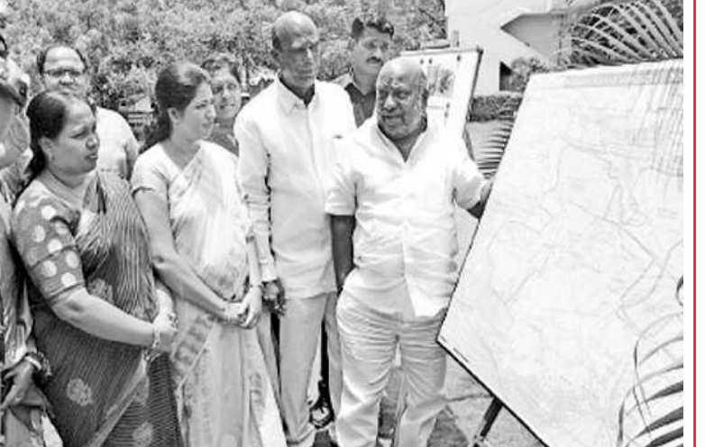
లక్ష్యంగా పెట్టుకున్నామన్నారు. మేడిపల్లి శాంతివనం, భాగ్యనగర్ నందనవనం, ఘట్కెసర్, నారపల్లిలోని ఉద్యానాలను కూడా సందర్శకులకు చేరువ చేయాలనేది ముఖ్యమంత్రి లక్ష్యం. అందుకోసం ఎలాంటి చర్యలు తీసుకోవాలనే అంశంపై ఆలోచనలు చేస్తామని కమిషనర్ చెప్పారు.