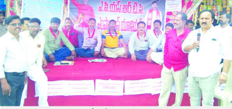
నిరాహారదీక్ష చేస్తున్న ఆర్టీసీ కార్మికులు