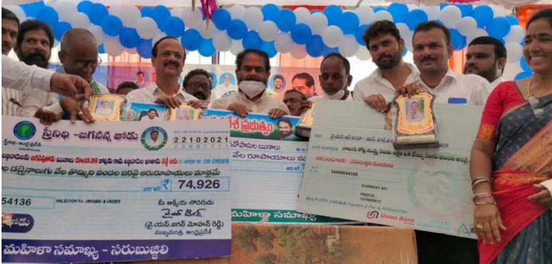
ముహూలా సమాఖ్య - సరుబుజ్జలి