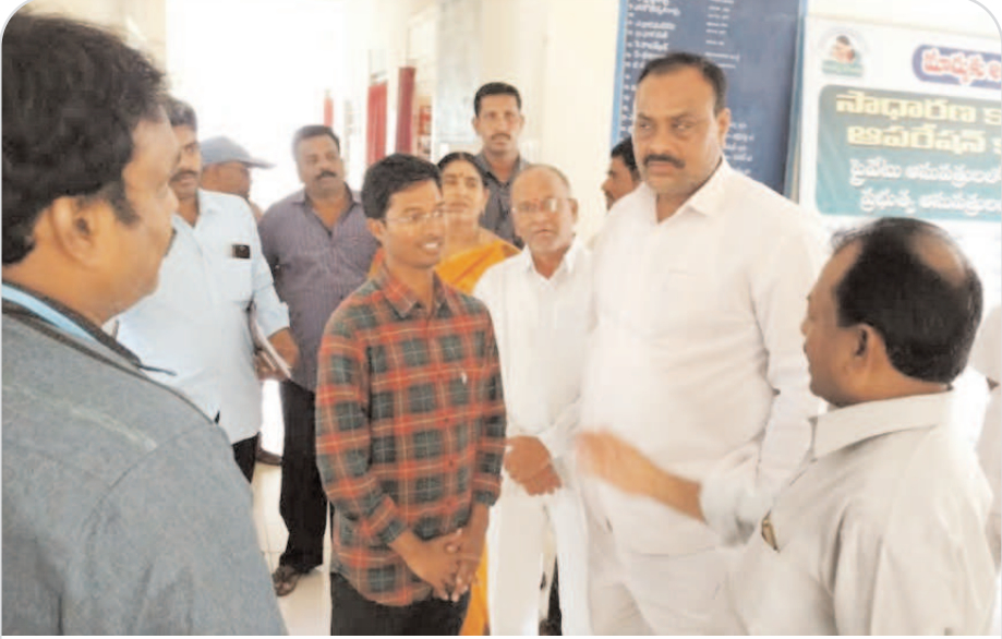
కోటబొమ్మగి మండలం కొత్తపల్లి ప్రాథమిక ఆరోగ్య కేంద్రంను ఆకస్మికంగా తనిఖీ చేసి రికార్డులను పరిశీలించిన ఆంధ్రప్రదేశ్ రాష్ట్ర రవాణా శాఖ, బీసీ సంతకేమ శాఖ మంత్రి కింజరాపు అన్నయ్యుడు