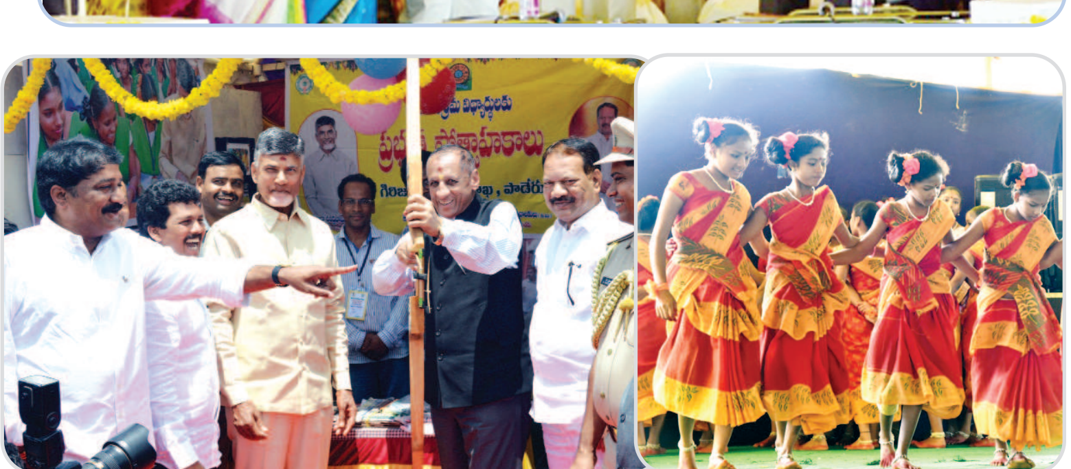
శ్రీకాకుళం, పాతపట్నం మండల కేంద్రంలో ఏర్పాటు చేసిన ప్రపంచ ఆదివాసి దినోత్సవం కార్యక్రమంలో పాల్గొన్న గౌరవ ఆంధ్రప్రదేశ్ రాష్ట్ర రవాణా శాఖ, బీసీ సంకేమ శాఖ మంత్రి శ్రీ కింజరాపు అచ్యుత్నాయుడు గారు మరియు స్థానిక ఎమ్మెల్యే కలమట, ఎమ్మెల్యే శత్రువర్ధ, జిల్లా కలెక్టర్, బిటిడిఎ పిట