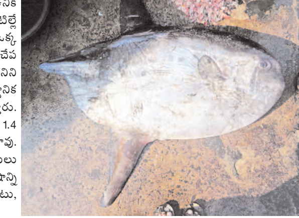
ఆకారంలో ఉంటుంది. రెండు పళ్లు ఉంటాయి. ప్రపంచం మొత్తమ్మీద ఇలాంటి జాతి చేపలు 4 రకాలే ఉంటాయని పరిశోధకులు చెబుతున్నారు. ఈ షార్క్‌లైట్ చేపకు దగ్గర పోలికలున్న మరో రకం చేప పశ్చిమ తీరంలో ఉన్నట్టు ఇదివరకు గుర్తించారు. కానీ దానికి తోక మాత్రం ఉండదు. దీనిని శాస్త్రీయ పరిభాషలో మోలామోలాగా పిలుస్తారు. కాగా కప్ప చేపలు విషపూరితమని స్థానిక మత్స్యకారులకు తెలుసు. వీటిని తినడం ప్రాణాంతకమన్న విషయంపై అవగాహన కల్పించాల్సి ఉందని పరిశోధకులు చెబుతున్నారు.

విశాఖపట్నం: విశాఖ తీరంలో విషపు చేపల ఉనికి వెల్లడయింది. వీటిని తింటే ప్రాణాలకే ముప్పు వాటిల్లే ప్రమాదం ఉంది. దేశంలోని తూర్పు తీరంలోకిలా ఒక్క విశాఖలోనే అత్యంత అరుదైన షార్క్‌లైట్ మోలా రకం చేప ఉన్నట్టు పరిశోధకుల పరిశీలనలో తేలింది. దీనిని సన్‌ఫిషిగాను, పఫర్ ఫిషిగా కూడా వ్యవహరిస్తారు. స్థానిక మత్స్యకారులు కప్ప చేపగా పిలుస్తారు. అర్ధవంద్రాకారంలో సుమారు 4045 కిలోల బరువు, 1.4 మీటర్ల పొడవు ఉండే ఈ చేపలు తినేందుకు పనికిరావు. వీటిలో విషపూరితమైన సఫర్ పాయిజన్ గ్రంథులు ఎక్కువగా ఉంటాయి. ఇవి డెట్రాడోటాక్సిన్ అనే విషాన్ని విడుదలచేస్తాయి. వీటిని తింటే వాంతులవడంతోపాటు, పక్షవాతానికి గురై మరణిస్తారు కూడా.