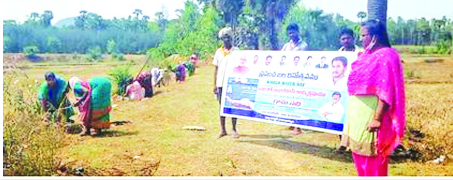
శ్రమదానం చేస్తున్న కూలీలు

మాకవరపాలెం : మాకవరపాలెం మండలంలో పలు గ్రామాల్లో జలశక్తి అభియాన్ పథకంలో భాగంగా ఉపాధి కూలీలు కాలవ గట్టు, చెరువు గట్టుపై శ్రమదానం నిర్వహించారు. ఈ