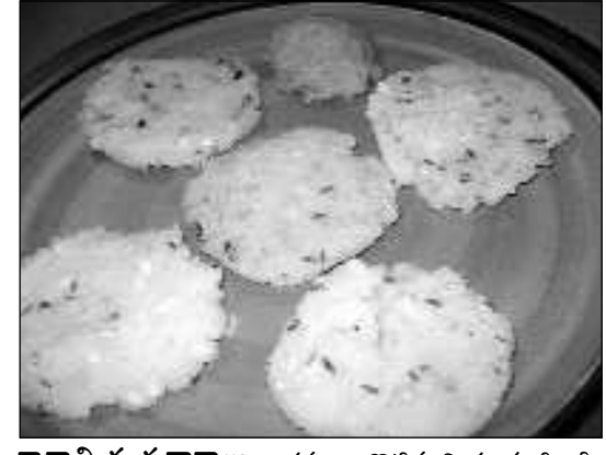
కావల్సిన పదార్థాలు: రవ్వలా కొట్టిన బియ్యపు పిండి - రెండు కప్పులు, శనగపప్పు - అర కప్పు, నెయ్యి - ఒక స్పూన్, ఉప్పు, నీళ్లు - తగినంత.

తయారుచేయు విధానం: ముందుగా రాతిపూటే బియ్యం నానబెట్టుకొని తెల్లారాక మిక్సీలో రవ్వలా వేసుకోవాలి. అలాగే శనగలను 15 నిమిషాలపాటు నానబెట్టుకోవాలి. తర్వాత శ్లా మీద మందపాటి గిన్నె పెట్టి వేడయ్యక, అందులో స్పూన్ నెయ్యి వేసి శనగపప్పును వేసి కొద్దిగా వేగనివ్వాలి. శనగపప్పు వేగాక వెంటనే నీళ్లు పోసి మరగనివ్వాలి. అందులో తగిన ఉప్పు వేసి, ఆ తర్వాత బియ్యపు పిండిని వేసి ఉండలు లేకుండా కలియబెట్టుకోవాలి. వెంటనే మూతపెట్టి 4-5 నిమిషాలు ఉక్కిరిపట్టాలి. నీరంతా పిండి పీచ్యేసుకున్నాక శ్లా మీద నుంచి దించేసుకోవాలి. ఆ పిండితో నచ్చిన సైజులో ఉండలు చేసుకోవాలి. వీటిని ఇడ్లీ ప్లేట్లో పెట్టి 25 నిమిషాలు ఆవిరిపై ఉడకనివ్వాలి. అంతే కుడుములు రెడి.