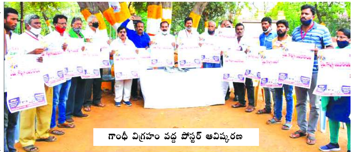
గాంధీ విగ్రహం వద్ద పోస్టర్ ఆవిష్కరణ