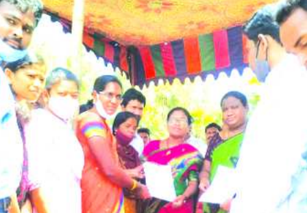
ఎంపీ, ఎమ్మెల్యేకు వినతిపత్రం అందజేస్తున్న దృశ్యం

కొయ్యూరు : ఇంగ్లీషు అండ్ లైఫ్ స్కీల్స్, ఐటి ట్రైనింగ్లు కొయ్యూరు మండలం శరభస్థాపాలెం గ్రామంలో అరకు ఎంపీ గొడ్డేటి మాధవ్, పాడేరు ఎమ్మెల్యే కొట్లగుళ్ళి భాగ్యలక్ష్మిలను కలిసి ట్రైబల్ వెల్ఫేర్, ఆశ్రమ, సాంఘిక సంక్షేమ పాఠశాలలో గత మూడు సంవత్సరాల నుంచి తమ సేవలను అందిస్తున్న ట్రైనింగ్లను వైభవ్య వికాస్ ప్రాజెక్టులో కొనసాగిస్తూ, ఏపీసిఐఎస్ లో విలీనం చేయాలని వినతిపత్రం అందజేశారు.